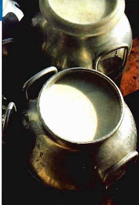
En 1993, se registró un importante incremento en las importaciones de leche.

La exportación de frutas y hortalizas ha crecido durante 1993 un 17% en volumen, especialmente significativo ha sido