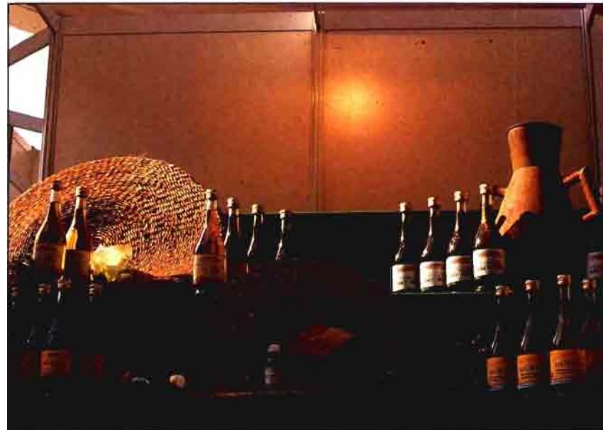
Las exportaciones de aceite de oliva aumentaron un 28,3% con respecto a 1992.

En exportación, aunque la balanza láctea es deficitaria, se incrementan los envíos de leche en pequeños envases y de leche condensada.