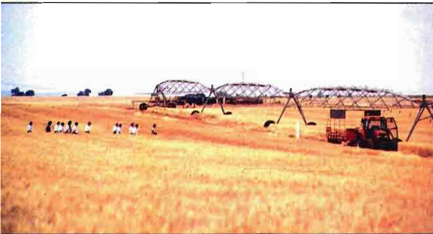
En Los Jarales se hacen ensayos y se cultivan 500 ha de trigo duro. Grupo de agricultores visitan los ensayos.