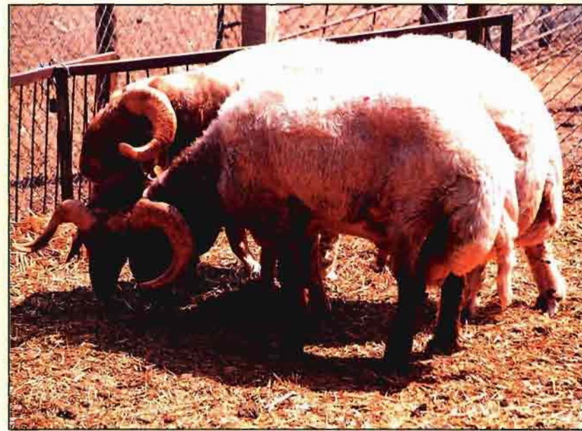
Moruecos de raza pura Awassi, presente en la explotación desde 1971.

lo más uniformes posible de un año a otro, facilitando un mejor control presupuestario.