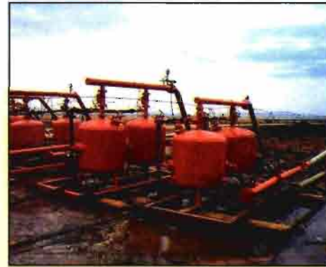
El riego mediante pivot y por goteo y un parque de maquinaria adecuado, son básicos en la explotación.

la aplicación exacta y repetida de tratamientos a los cultivos con mínima mano de obra y máximo rendimiento hectáreas por hora. Su precisión es de \pm 0,3\% la dosis. Es una pieza esencial para la política de tratamientos adoptada desde la formación de Malpica-Velcourt.