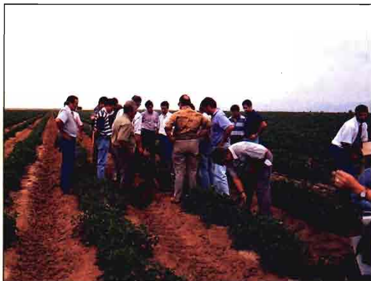
Cultivos de maíz dulce y tomate con rendimientos extraordinarios.

pastores y vaqueros, 4; obreros fijos, 2; futuros gerentes en fase de aprendizaje, 2 (Malpica Velcourt).