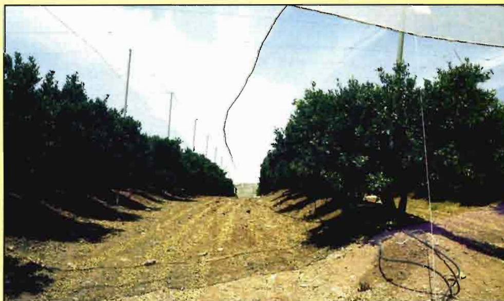
Algunos productos aplicados en cítricos ya no están autorizados por su impacto negativo sobre poblaciones de enemigos naturales.

Sombreado: Ingredientes activos autorizados en Producción Integrada (Comunidad Valenciana).