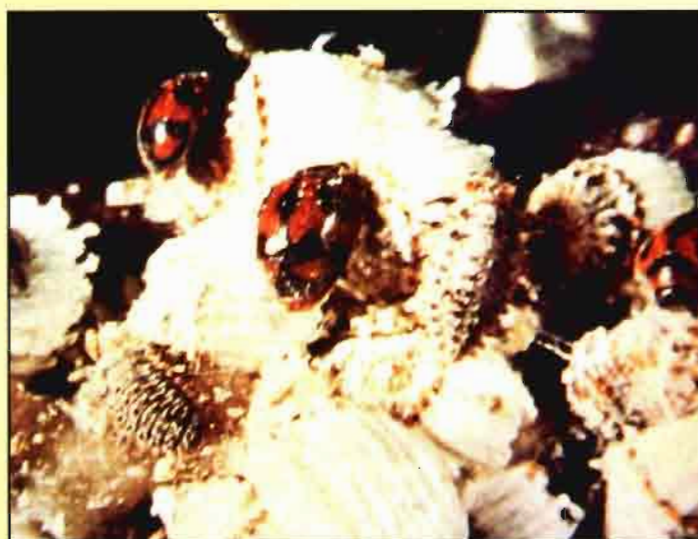
Rodolia cardinalis parasitando a Icerya purchasi .

Además de éstos, los pulgones ( Aphis gossypii , A. spiraecola y Toxoptera aurantii ), la araña roja, Tetranychus urticae (Acarina, Tetranychidae), y el minador de las hojas de los cítricos, Phyllocnistis citrella (Lepidoptera, Gracillariidae) pueden presentar problemas en determinadas circunstancias. La mosca mediterránea de la fruta, Ceratitis capitata (Diptera, Tephritidae) también necesita tratamiento aparte por ser, además, plaga de importancia cuarentenaria. Normalmente, todo este último grupo de fitófagos se maneja mediante lucha química. Por ello, es de suma importancia conocer los efectos que los plaguicidas a emplear puedan tener sobre los enemigos naturales responsables del buen control del primer grupo de fitófagos y, en base a ello, establecer estrategias de conservación de la artrópoda útil.