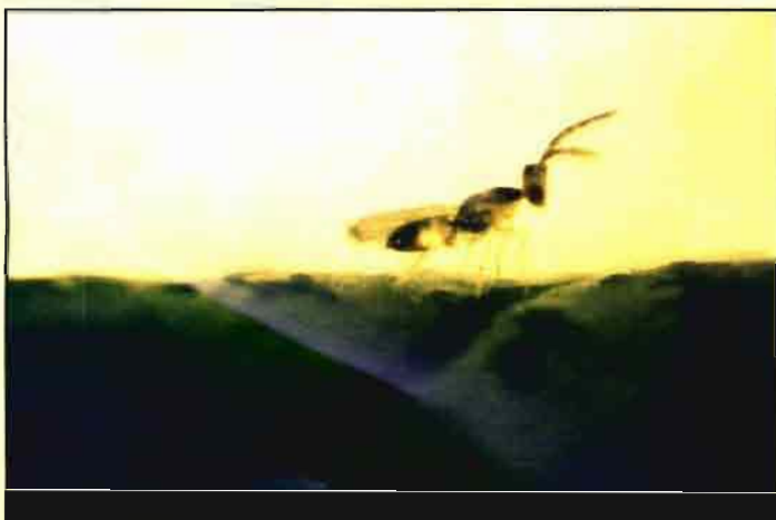
Insecto macho de Quadrastichus , enemigo del "minador".

Un paso importante de cara al establecimiento de estrategias de Manejo Integrado de Plagas (MIP) consiste en la evaluación del impacto de los plaguicidas sobre los enemigos naturales de las plagas de los cultivos. El MIP necesita fitosanitarios selectivos que puedan usarse de la forma menos agresiva posible para la actividad de los enemigos naturales más importantes. Nuestra citricultura hace