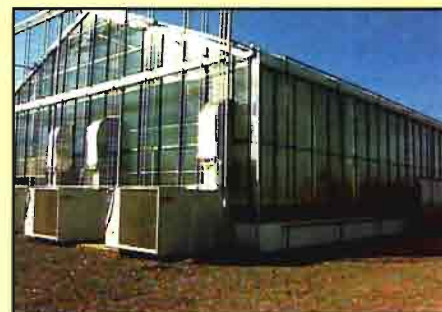
Estación de cuarentena para la introducción de insectos (IVIA).