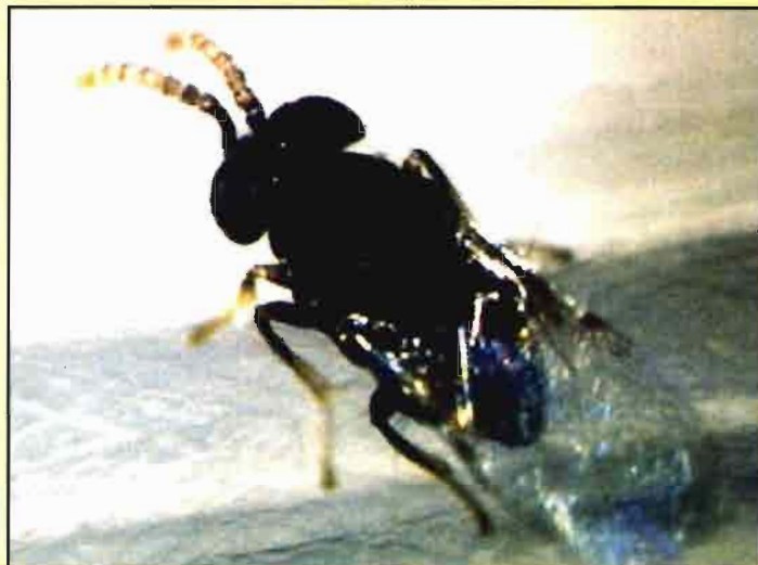
Adulto de Ageniaspis citricola , parásito del "minador de los cítricos".

Son tres cochinillas las consideradas como plagas llave de nuestra citricultura: Parlatoria pergandei , Cornuaspis beckii y Aonidiella aurantii . Además, los pulgones ( Aphis gossypii , A. spiraecola y Toxoptera aurantii ), la araña roja ( Tetranychus urticae ) y el minador de las hojas ( Phyllocnistis citrella ) pueden necesitar de alguna atención especial, así como la mosca de la fruta, Ceratitis capitata , sujeta a