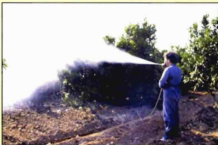
Los pulgones, la araña roja y el minador de las hojas requieren lucha química.