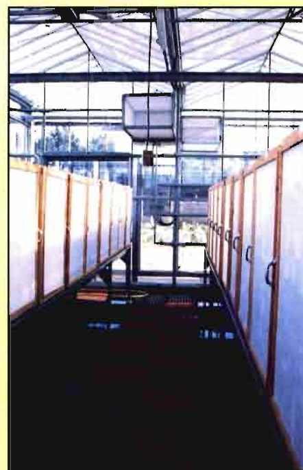
Interior de un insectario para la cría de insectos útiles.

taceipes (toxicidad media: 1,5 \pm 0,1 ; n = 43 ) > R. cardinalis (t. m.: 2,2 \pm 0,2 ; n = 39 ) > C. noacki (t.m.: 2,3 \pm 0,1 ; n = 62 ) > E. stipulatus (t.m.: 2,4 \pm 0,1 ; n = 60 ) > C. montrouzieri (t.m.: 2,6 \pm 0,2 ; n = 39 ) > L. dactylopii (t.m.: 2,7 \pm 0,2 ; n = 30 ). En un listado similar Croft (1990), daba una toxicidad media de 3,0 (en una escala de 1 a 5; n = 114 ) para C. montrouzieri , y de 3,5 ( n = 139 ) para L. dactylopii . Los depredadores suelen ser menos sensibles a los plaguicidas que los parasitoides. Por ello, los resultados correspondientes a C. noacki y, especialmente, a L. testaceipes pueden parecer extraños. Sin embargo, no hay que olvidar que los ensayos con estas dos especies se realizaron sobre el estado de vida más protegido (inmaduros protegidos en el interior de los puparios de la mosca blanca y de las momias de pulgones respectivamente), lo cual explicaría esa aparente anomalía.