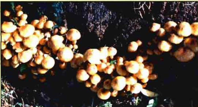
Figura 2. Setas o cuerpos fructíferos de A. mellea .

Sin embargo, con frecuencia estas medidas no evitan la presencia del patógeno, por eso cuando se detectan plantas infectadas es necesario arrancarlas y quemarlas. Otra alternativa cuando aparece la enfermedad es aplicar fumigantes de suelo (tetratiocarbonato de