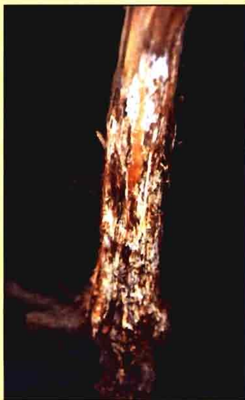
Figura 1. Micelio de A. mellea en vid.

Ante esta situación, durante los años 1993-95 se llevaron a cabo en la EFA, en colaboración con la Consellería de Agricultura, Ganadería y Producción Agroalimentaria de la Xunta de Galicia, los primeros estudios sobre la incidencia de Armillaria en viñedos pertenecientes a la Denominación de Origen Rías Baixas, situada en la provincia de Pontevedra. Se encontró una incidencia aún mayor de podredumbre blanca, ya que un 42% de las cepas analizadas presentó un micelio