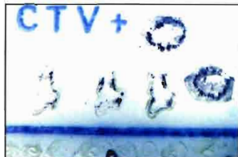
Foto arriba. Se ha diseñado un estuche de diagnóstico de CTV que permite su uso a personal no especializado. En el mismo se incluyen todos los reactivos necesarios, comprendido controles negativos preimpresos en las membranas.