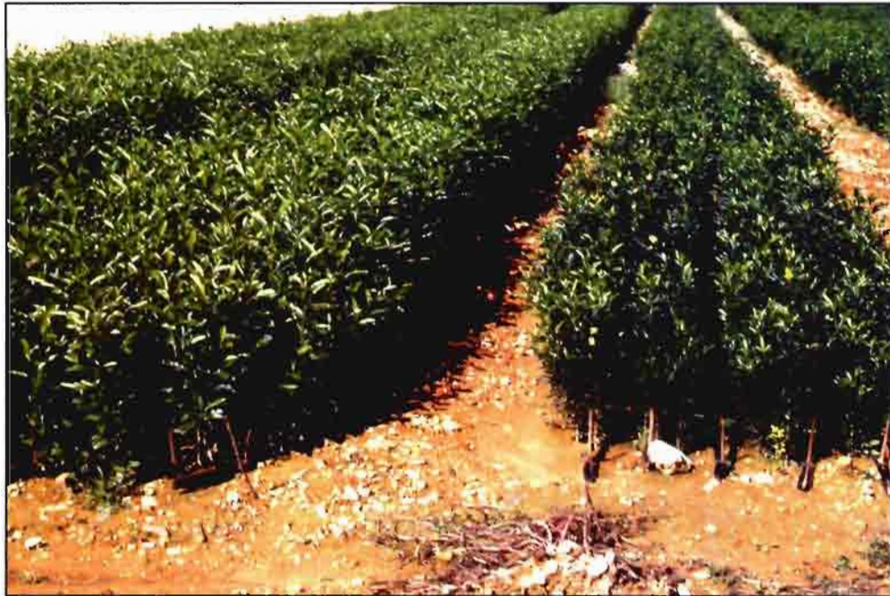
La aplicación de la técnica de inmunopresión-ELISA facilita la producción de plantas libres de CTV en los viveros españoles sujetos a un programa de certificación, en los que se producen anualmente unos 7 millones de plantas.

los, para exportar plántones producidos en nuestro país. Además, ha hecho posible realizar prospecciones a menor coste económico y de una forma más simple.