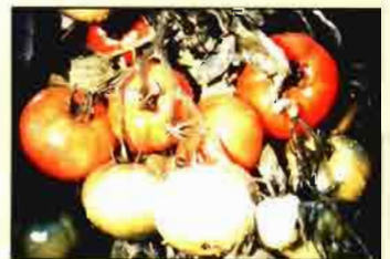
CEN-20, especial para engorde de cítricos.

«BERLIN EXPORT», a la cabeza de la alta tecnología con sus abonos CEN conocidos internacionalmente por sus excelentes resultados: nutrición equilibrada, uniformidad y peso específico , así como una óptima calidad según exigen los mercados internacionales, ha conseguido aumentar considerablemente las vitaminas A y C en frutas y hortalizas y el LICOPENO (anticancerígeno) en tomate.