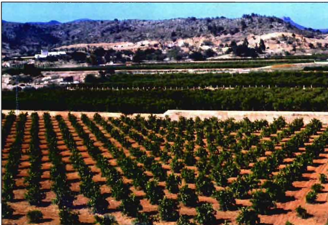
El problema de la tristeza está resuelto en las nuevas plantaciones si no se introducen razas del virus más agresivas. Más de 95 millones de plantas certificadas "libres de virus" e injertadas sobre patrones tolerantes a tristeza, han ido sustituyendo a la citricultura clásica basada en el uso del patrón naranjo amargo.

Las repercusiones de los nuevos métodos de diagnóstico en la lucha y control de la tristeza son muy claras. Especialmente, la disponibilidad de un estuche comercial de inmunopresión-ELISA permite mantener la producción de plantas sin CTV en zonas endémicas de la enfermedad, la realización de numerosos controles y la emisión de certificados individuales, si fuera necesario emitir-