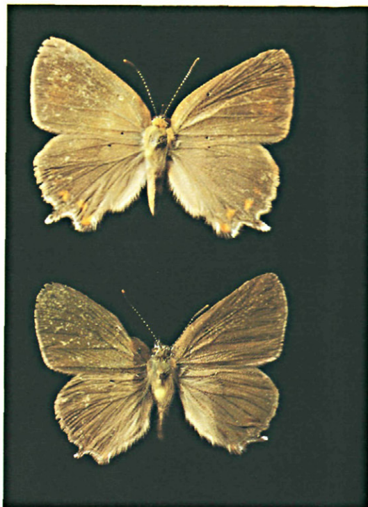
Fig. 2.—Imagos de Satyrium esculi Hb.

Signos convencionales: . puesta; - oruga; + imago; ● crisálida; ● crisálida enterrada.