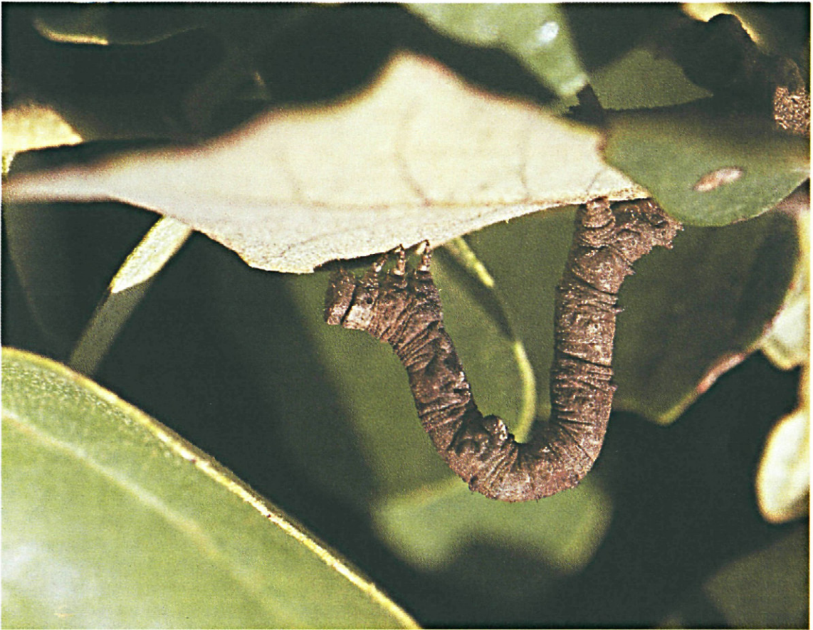
Fig. 15.—Oruga de Peribatodes manuelaria Herrich Schaffer.

Oruga. La mayoría de las orugas de esta especie que se han recogido son de color marrón o marrón-rojizo, con dos protuberancias laterales bastante aparentes en el 5.º segmento, algo más oscuras que el resto del cuerpo, se observan también dos pequeñas protuberancias dorsales a partir del 2.º segmento. Figuras 15 y 16.