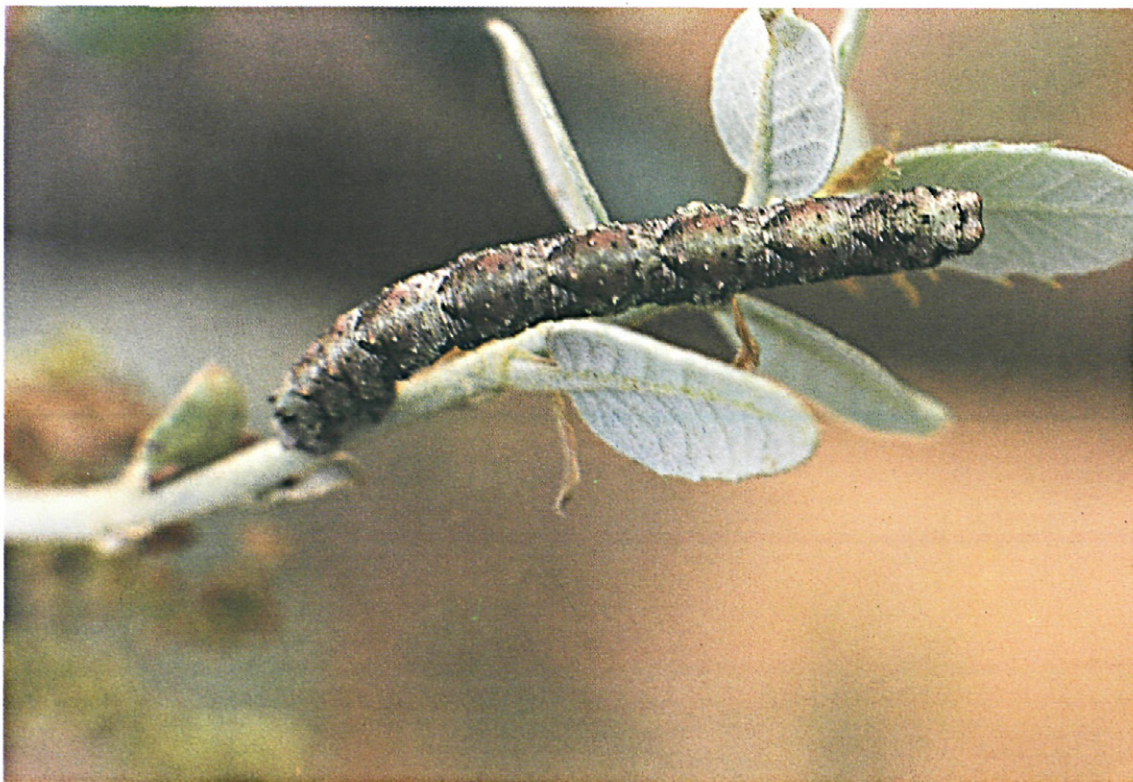
Fig. 16.—Oruga de Peribatodes manuelaria Herrich|Schaffer.

donde la oruga permanece 3 ó 4 días antes de su transformación.