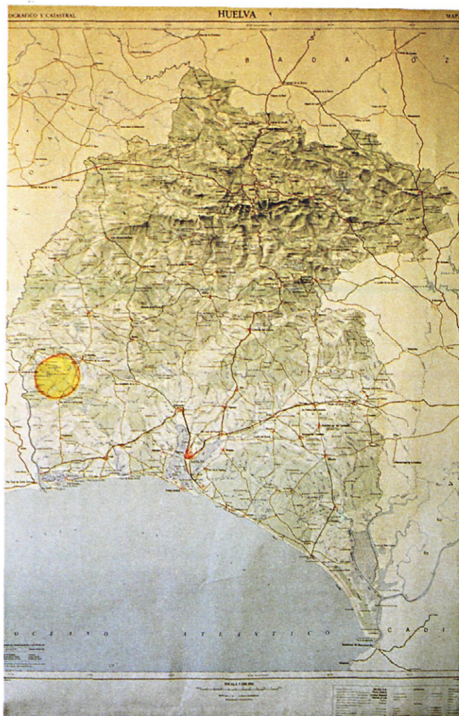
Fig. 1.—Mapa a escala 1:200.000 de la provincia de Huelva, situando la zona de recogida de muestras.

Las orugas de ésta especie tienen movimientos lentos, encontrándose generalmente en el envés de las hojas de encina, mide unos 13 mm. de longitud y 6 mm. de anchura. Figuras 3.