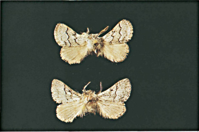
Fig. 9.—Imagos de Trichiura ilicis Rambur.