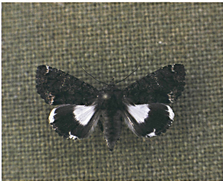
Fig. 11.—Imago de Catephia alchymista D & Schiff.

La cabeza es de color marrón-grisácea con pelos blanquecinos aparentes a simple vista, siendo amarillo el borde del escudo protorácico. Figura 13.