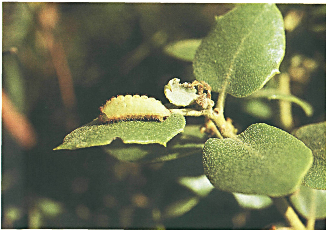
Fig. 3.—Oruga de Satyrium esculi Hb.