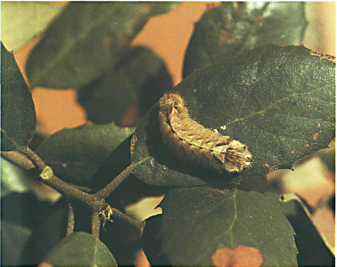
Fig. 6.—Oruga de Quercusia quercus L.