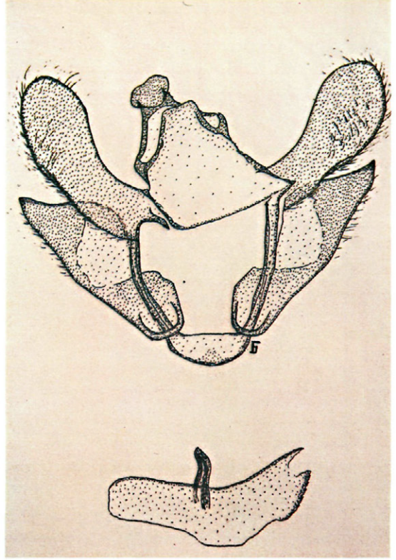
Lámina I.—Andropigio de Trichiura ilicis Rambur.