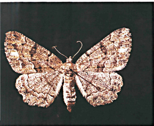
Fig. 14.—Imago de Peribatodes manuelaria Herrich-Schaffer.

Crisálida. La crisálida es marrón y mide aproximadamente 11-12 mm. efectuándose la transformación en un capullo construido para tal fin. Este período dura entre 10 y 15 días.