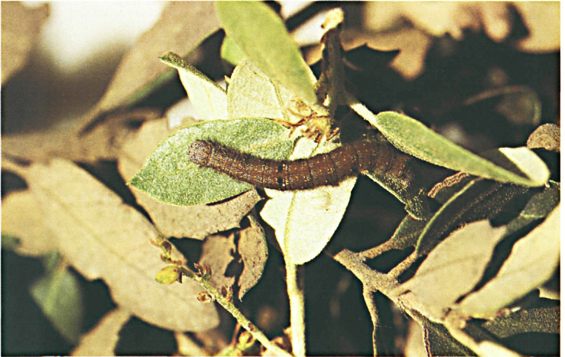
Fig. 10.—Oruga de Trichiura ilicis Rambur.