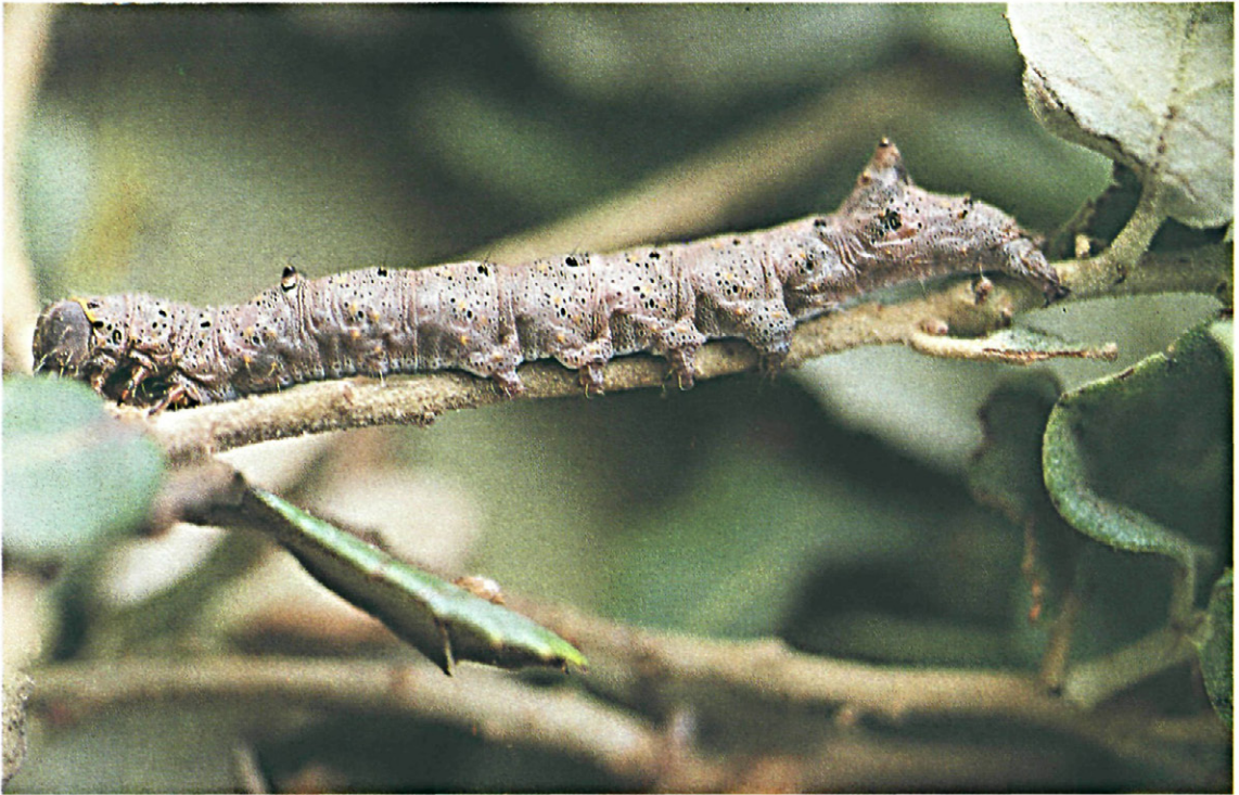
Fig. 12.—Oruga de Catephia alchymista D & Schiff.