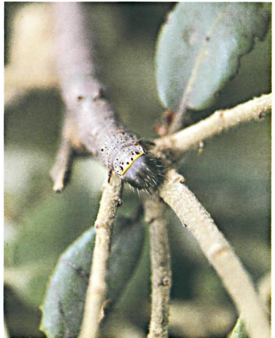
Fig. 13.—Detalle de la cabeza de la oruga de C. alchymista D & Schiff.