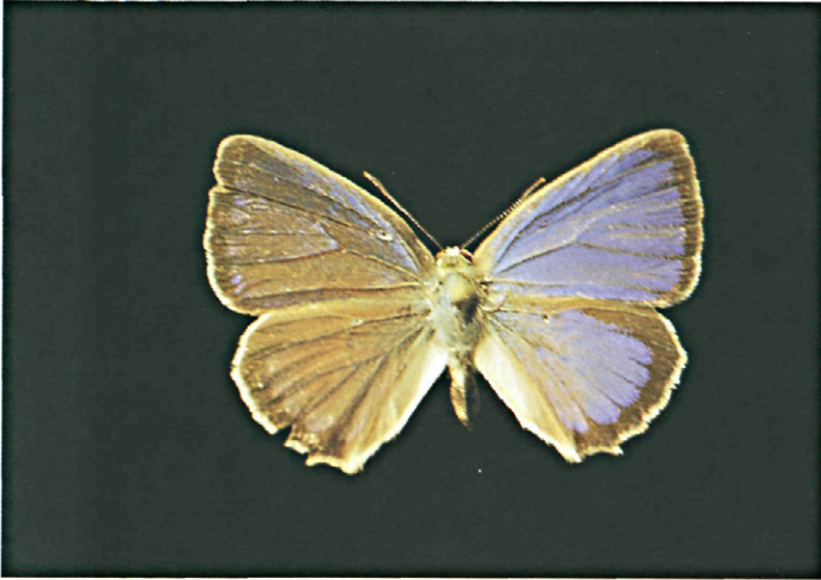
Fig. 5.—Imago de Quercusia quercus L.