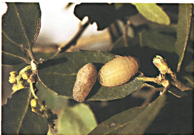
Fig. 4.—Oruga a punto de crisalidar y crisálida de Satyrium esculi Hb.