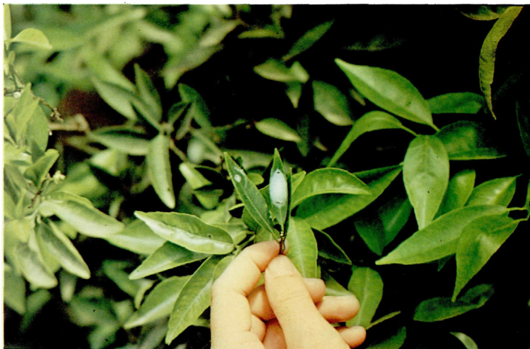
Fig. 5. Dos hojas, una con la telilla de envoltura de la pupa de C. psociformis , y la otra con la telilla más grande de un arácnido.