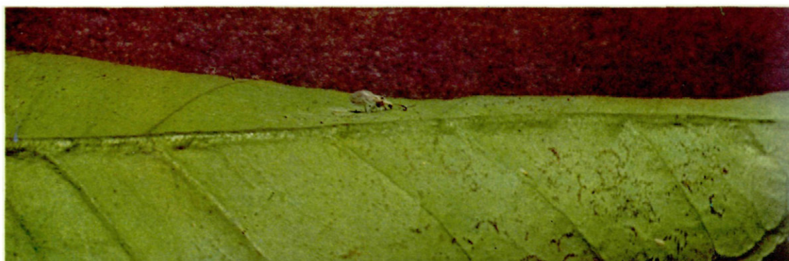
Fig. 2. Adulto de C. psociformis sobre una hoja con puesta de «mosca blanca».

nuestras observaciones de campo, sin embargo durante el tiempo en que los adultos permanecieron en el evolucionario citado anteriormente, se consiguió observar la puesta sobre las hojas atacadas de T. urticae no realizándola sobre la cabeza infectada de A. nerii .