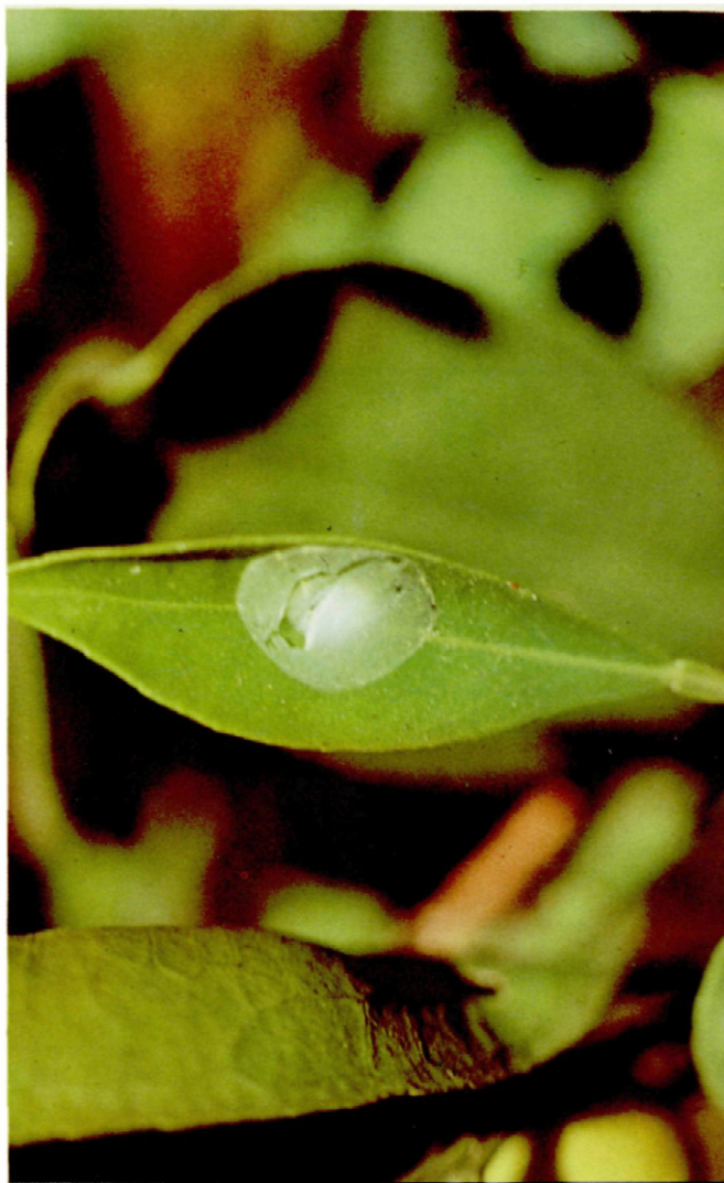
Fig. 4. Aspecto de la telilla rota por la emergencia del adulto de C. psociformis .

den alimentarse de cochinillas y áfidos (VIGGIANI, 1977). Mediante nuestras observaciones de campo y laboratorio, hemos visto como las larvas se alimentaban de huevos y larvas de «mosca blanca», succionando su contenido arqueando el cuerpo y apoyándose con la extremidad del mismo. Aunque no hemos podido constatar que se alimentan también de áca-