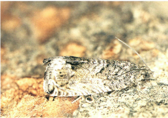
Fig. 3.—Imagos de C. fagiglandana (Zeller):

gadas a cambiar de fruto, las reservas alimentarias son suficientes para asegurar un desarrollo normal, en cambio, cuando se trata de los hayucos, las semillas que contiene son pequeñas y a veces no todas son fértiles, cambiando frecuentemente de una semilla a otra y de un hayuco a otro, hasta que, cuando los frutos infestados caen al suelo en los meses de septiembre, octubre y noviembre, las orugas, tras permanecer según los casos, algún tiempo en el fruto caído, lo abandonan para hilar un capullo de seda bajo la hojarasca y permanecer en él, en diapausa invernal hasta el mes de abril poco más o menos, crisalidando entonces, estadio éste, que dura solamente unos quince días aproximadamente, depende de las condiciones climáticas del lugar y del año, hasta el avivamiento del imago, empezando seguidamente un nuevo