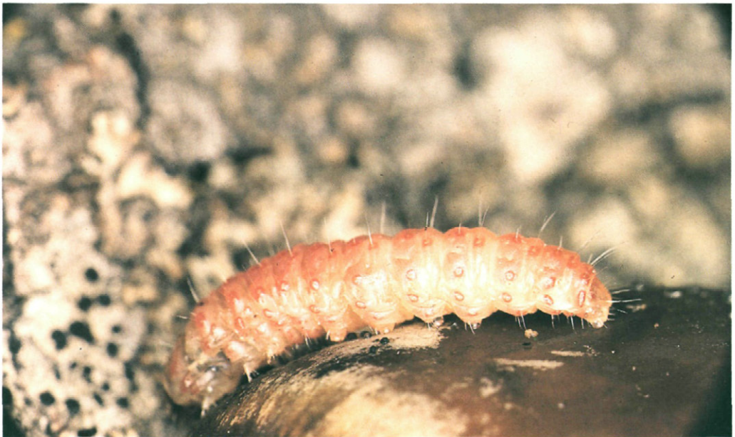
Fig. 2.— Cydia fagiglandana (Zeller) en bellota de encina: a) Oruga en fase roja b) Cabeza y escudo protorácico de una oruga en fase roja. c) Oruga vista de costado en fase roja.