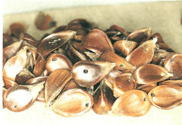
Fig. 4.—Semillas de haya infestadas de C. fagiglandana (Z), fácilmente detectadas por el orificio existente.

Puerto de San Isidro. Recogida de semillas de haya en árbol. Fecha: última decena de septiembre de 1992.