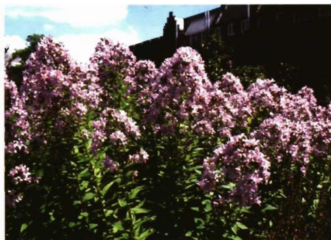
Campanula lactiflora 'Pritchard's Variety'