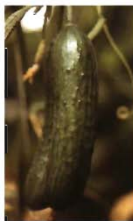
Pepino tipo Bet Alpha.

En los bancos de germoplasma europeos existían, en 2002,