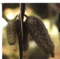
Pepino tipo Pickering.

(Díez, 2002). La mayor colección de esta especie está en N. I. Vavilov Research Institute of Plant Industry (Federación Rusa), con 2498 entradas, de las cuales 1416 son variedades locales antiguas (Piskunova, 2002). Turquía posee la segunda mayor colección europea, con 329 entradas (Díez, 2002).