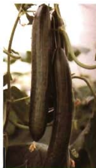
Pepino tipo Long.

6.937 entradas de Cucurbita , de las cuales 3.541 eran de C. pepo (Díez, 2002). N. I. Vavilov Research Institute of Plant Industry tiene la mayor colección con 2.064 entradas, 1004 de ellas de C. pepo (Piskunova, 2002). Otra colección europea importante está en la Universidad Politécnica de Valencia (España), donde existen 925 entradas de Cucurbita , de las cuales 291 son de C. pepo (Picó, 2002).