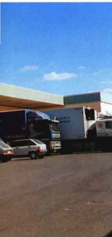
En la Argentina pocas empresas de transporte por camión trabajan con estándares de eficiencia internacional

nivel nacional para las frutas y hortalizas. Las centrales de compra de las grandes cadenas de supermercados no operan sino marginalmente en el sector de frutas y hortalizas. Por ello, los frutas y hortalizas importadas que son vendidas por las empresas de super e hipermercados brasileños pasan previamente por los mayoristas de los mercados físicos.