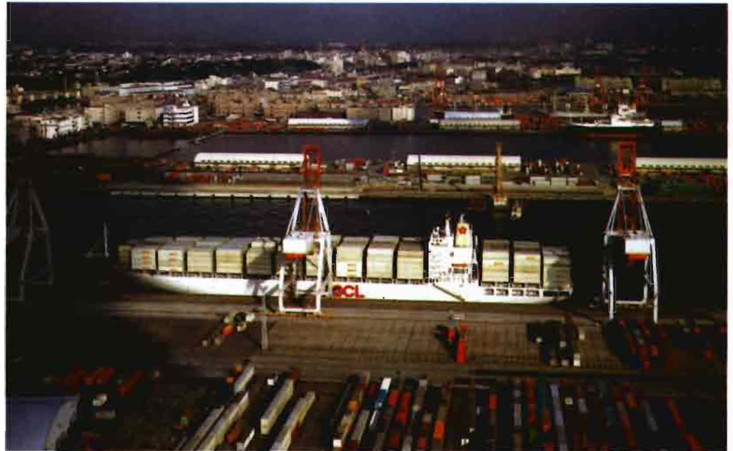
Figura 1: Exportaciones argentinas de frutas por puerto de embarque

El cambio del sistema de transporte marítimo, donde Buenos Aires y las exportaciones en contenedores por medio de líneas regulares, pasa a ser desplazado por exportaciones charterizadas (en tramping ) con destino a los puertos del norte de Europa, responde a la búsqueda de un mejor posicionamiento competitivo de las exportaciones del país por medio de una disminución de los costos de exportación marítima. Esta evolución tiene en cuenta que el costo del flete de frutas paleti-