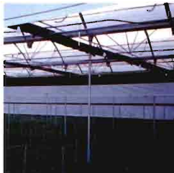
Pantallas térmicas y mallas

La Hortimación para agrocomponentes es una palabra que significa modernizar los sistemas tradicionales de producción hortícola