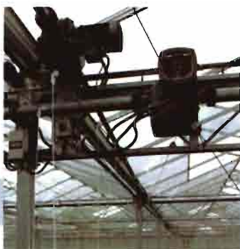
Sistemas de ventilación

Llámenos o consulte a los proveedores de Invernaderos más cualificados