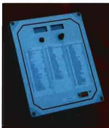
Automatismos y componentes