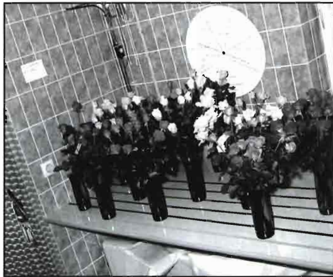
Sobre estas líneas, cultivo de rosas en Alemania. A la izquierda, test posrecolección para la vida de la flor cortada en jarrón. Abajo, variedades y tendencias en rosa cortada.

● Algunos de los factores importantes de competición son un buen clima para el cultivo y una infraestructura suficiente en cuanto a facilitar el transporte; las regiones con clima adverso tienen una tendencia decreciente, como es el caso de la producción en Alemania ●