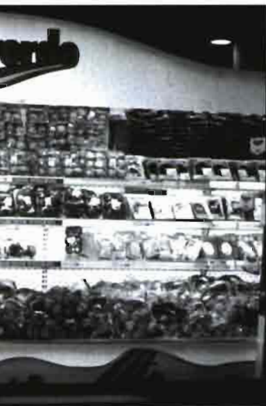
En la foto central inferior, gama de productos Almaverde en un supermercado italiano, la marca de Apofruit que identifica el género obtenido a través de técnicas de Producción Integrada. Arriba, a la derecha, recolección de melocotones en Emilia Romagna, donde se produce un tercio del total nacional.