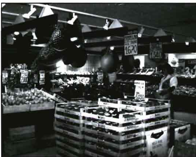
Los principales productos frutícolas italianos en el punto de venta.