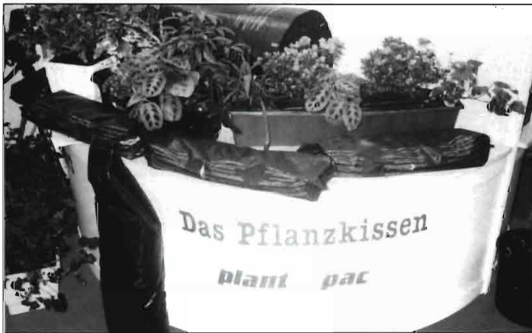
Esta imagen de la feria IPM '96 de Essen, Alemania, observamos un ejemplo plantas ornamentales en contenedor, así como los sacos de cultivo, cuya forma longitudinal se adapta a la de las macetas.

En comparación con los últimos 30 años, el futuro de los cultivo hidropónicos va a tener un excelente desarrollo.