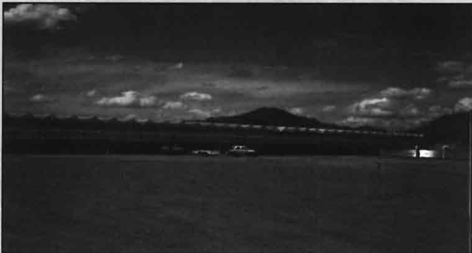
Vista general de Bonita nurseries en Arizona.

La experiencia de sus fundadores y las condiciones naturales del territorio convierten a Bonita nurseries en un importante centro de producción de tomates en cultivo hidropónico a nivel mundial.