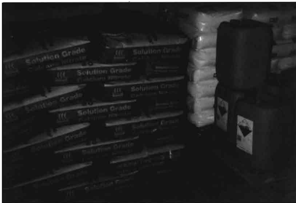
Cabezal de riego y colmenas de polinización en Arizona, Estados Unidos. Debajo, sala de mezclas donde se combinan distintos productos para adecuar la solución nutritiva al momento de cultivo.

La experiencia en la Antártica se realiza por similitud en extremas condiciones. El CAAP (CELSS, Antarctic Analog Project) se compone de las siguientes experiencias: granja, parque, acuicultura, procesamiento de aguas residuales, almacenamiento y equipo mecánicos.