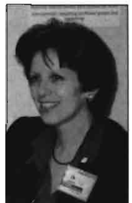
Por: Teresa Barbat Ing. Agrónomo WAGENINGEN (Holanda)