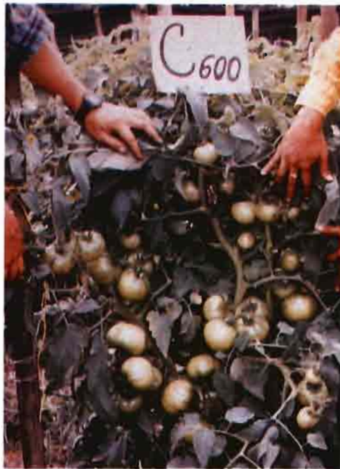
En la fotografía izquierda, llenado de trinchera con la mezcla de cachaza y carbonilla. A la derecha, producción de tomate ( Lycopersicon esculentum Mill.) en la mezcla de cachaza y carbonilla.

más gruesos tallos aéreos, que los obtenidos con el suelo de la finca (un Andisol de excelentes características físicas).