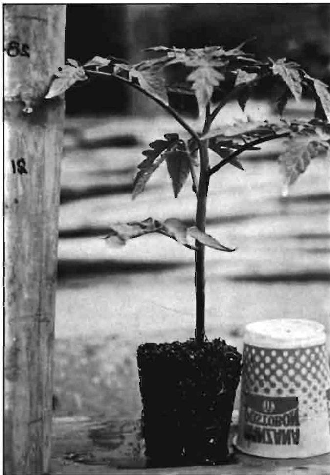
Plántula de tomate ( Lycopersicon esculentum Mill.) obtenida por el modelo V.S.P. (vaso, sustrato, planta).

En vista de los excelentes resultados obtenidos con la mezcla 3:1 (vol.: vol.) de cachaza y carbonilla en la producción de plántulas, se planteó un nuevo trabajo consistente en rellenar trincheras de 20 cm de profundidad y distantes 1,3 m en el suelo, con la misma mezcla de cachaza y carbonilla. La investigación se diseñó con unidades experimentales de 20 m, distribuidas en bloques completos al azar con tres repeticiones, y se compararon siembras de tomate en cachaza con y sin fertilización, y siembras de tomate en el suelo con y sin fertilización. La taxonomía del suelo utilizado en el ensayo correspondía a un Pachic Haplustoll de la serie Palmira, de alta fertilidad y excelentes características físicas.