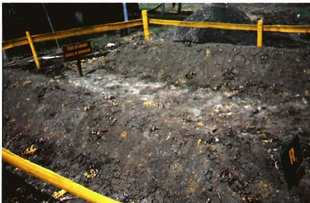
Pilas de cachaza en proceso de compostaje.

En la investigación realizada por Yepes (1994) a partir de muestras tomadas directamente de los filtros del Ingenio Manuelita, acomodadas en pilas de 50 cm de altura, las cuales recibieron 150 mm de precipitación durante cuatro meses, se encontró que elementos como B, Ca, Fe, Zn, Mn y Na disminuyeron; K y Cu aumentaron, mientras que el fósforo se mantuvo estable. Se encontraron además varios hongos de la clase