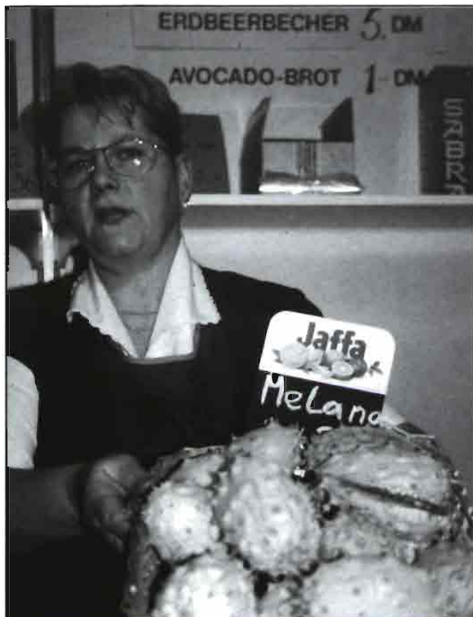
Los grandes productores, tienen claro que es necesario estar presente con productos diferenciados. En la foto la señora muestra orgullosa sus kiwanos Jaffa Israel. Llamativamente, el empresario español productor de frutas y hortalizas estuvo ausente.

allí, 9.000 m 2 para el desembarco de productos perecederos exclusivamente, los cuales pasan directamente a cámaras mantenidas a una temperatura constante de 12C°. Esta terminal entrará en servicio en abril de este año, con lo cual el aeropuerto de Frankfurt reforzará su ya importante rol, como aeropuerto comercial en Europa.