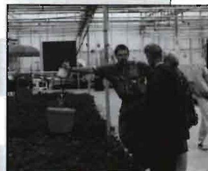
Cultivos en invernaderos y al aire libre de las «novedades» de plantas de vivero en la estación de investigación especializada en este tipo de plantas de Boskoop.