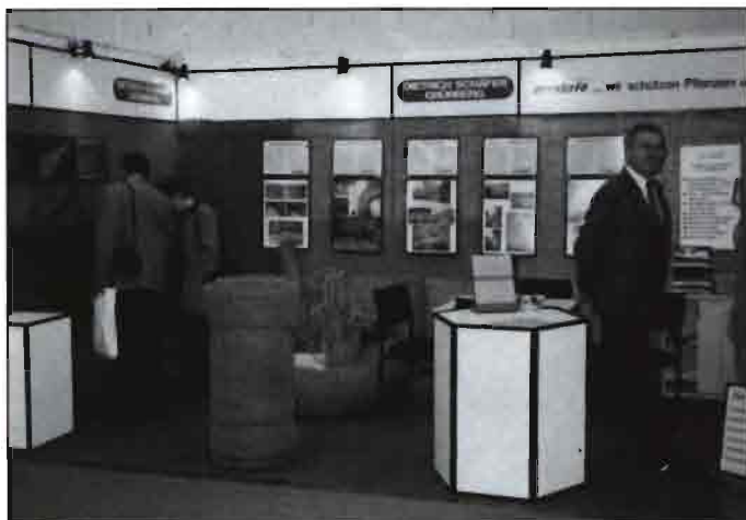
Foto tomada en Bélgica en una interrupción de descarga de una barcaza cargada de turba procedente de Alemania. Se trata de la empresa Westhoekveen especializada en sustratos -a medida- para viveros.