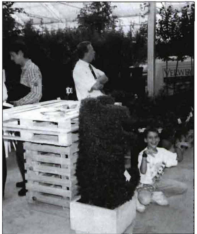
La normalización de los productos en las plantas de vivero para jardín y la competencia en novedades. Las dos fotos son de Plantarium, en una de ellas la importancia del etiquetado para el puesto de venta y en la otra una muestra en forma de oso de arte topiario, en la producción de vivero. Este tipo de figuras y las plantas acuáticas tienen una destacada importancia para los viveros holandeses.

Las empresas de viveros, y las organizaciones profesionales confían en mayores cotas de consumo de árboles y arbustos para jardín, urbanismo,