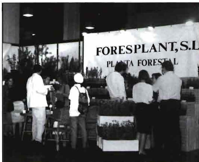
En España la exposición Iberflora de este año contó con la participación de más de 25 stands de asociaciones de viveristas.