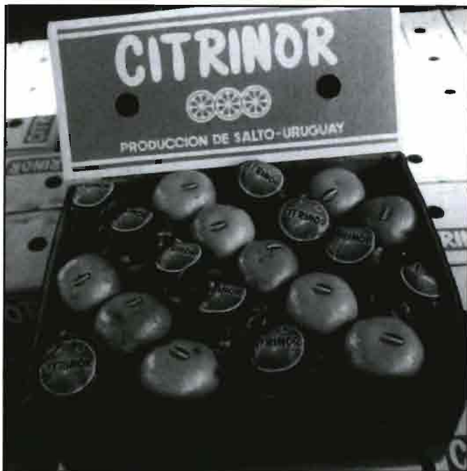
Cítricos de Uruguay para la exportación.