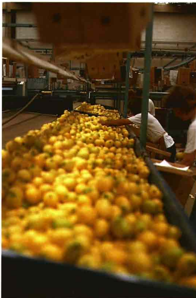
Almacén de empaque de limones, en los alrededores del puerto de Montevideo.

“ Las exportaciones de fruta fresca de Argentina en 1993 experimentaron una baja del orden de los 4 millones de cajas respecto a 1992, debido al volcado de grandes volúmenes al mercado interno de este país.”