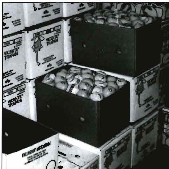
Limonos de exportación de Tucumán.

cado interno, el cual, sobreabastecido mostró signos de depresión de precios.