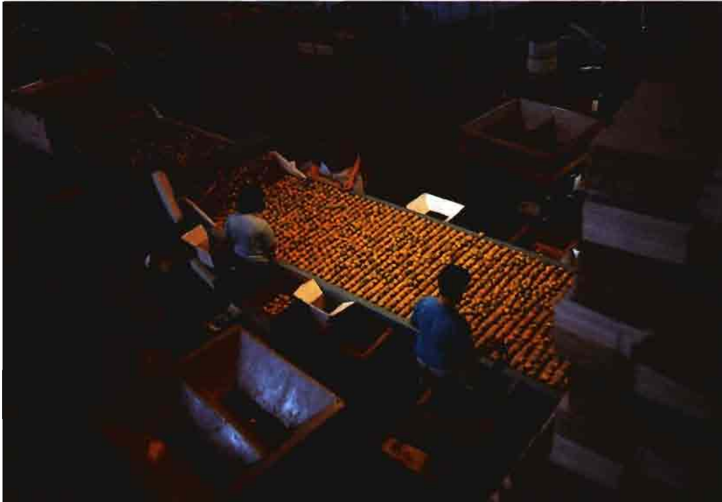
Almacén de empaque en Uruguay.

Qué paso en la temporada pasada y cuáles son las perspectivas de la actual