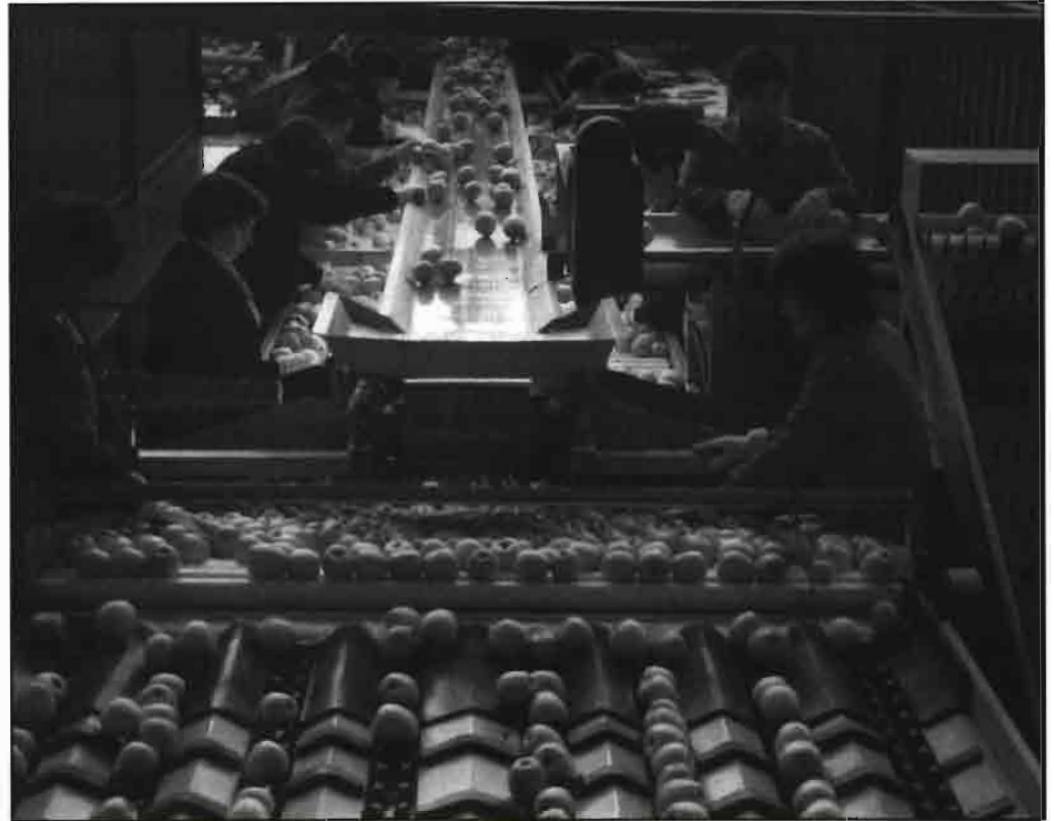
Momento de la selección de manzanas en un almacén de confección en Chile.

Algo semejante sucede con la producción de flores de corta, que en menores volúmenes, se producen bajo invernaderos adaptados. Simi-