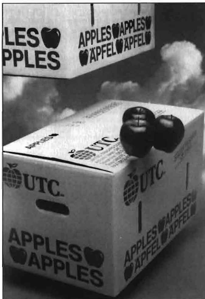
Caja de cartón para manzanas Stronbox, empresa de servicios chilena especializada en envases para frutas y hortalizas.

Como se ha señalado en los párrafos precedentes, en la zona de Quillota es posi-