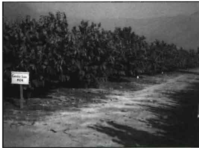
Arriba a la dcha., efecto de la helada de invierno (agosto 1993) sobre árboles de chirimoyo Concha Lisa, 4x4 de densidad de plantación, en un huerto de ensayo en el valle de Quillota.