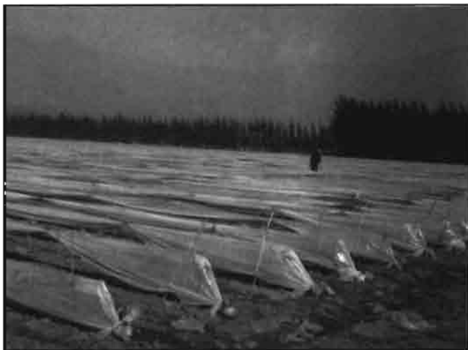
Arriba a la izq., cultivo de hortalizas «primor» en túneles de polietileno, para protección contra heladas en Quillota (Chile), agosto de 1993.

Como la mayor parte de la zona central de Chile, los suelos arables del área de Quillota son, predominantemente, de origen aluvial de formación reciente. En promedio se puede establecer que son suelos moderadamente profundos, de texturas medias, escasa pedregosidad con pendientes suaves. Existen pequeños sectores, especialmente los más cercanos al lecho del río y algunos esteros, en que se encuentran suelos con drenaje restringido, lo que im-