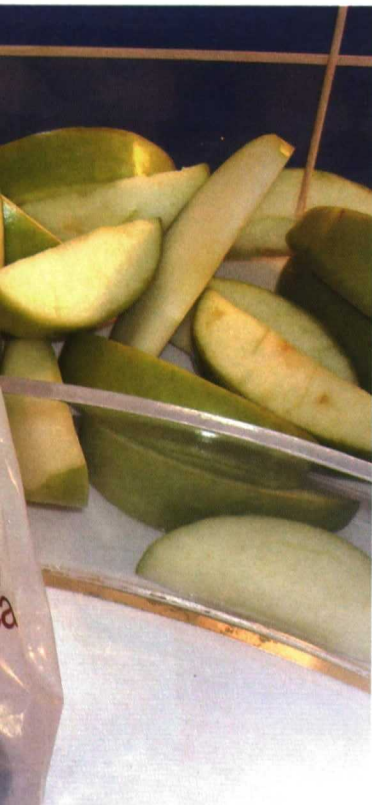
Manzana "a gajos", uno de los productos estrella de la IV gama como merienda para los colegios. Los recubrimientos comestibles evitan el pardeamiento.

ca inherente a los productos frescos recién cortados.