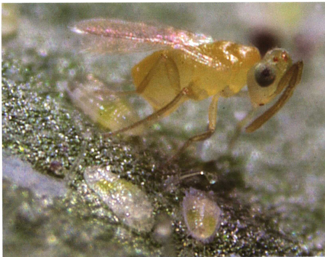
Adulto de Eretmocerus mundus parasitando Bemisia .