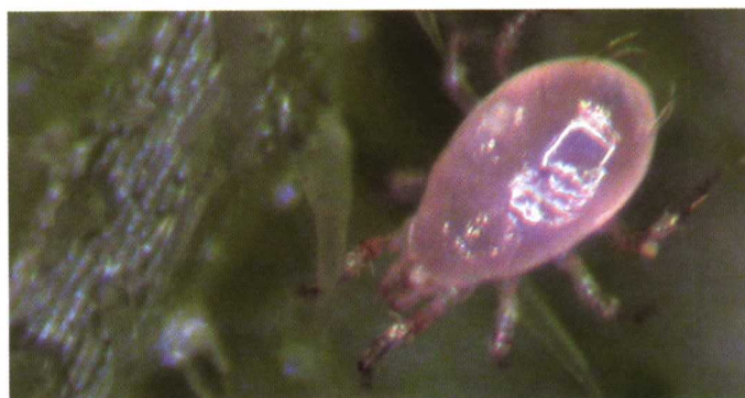
Adulto de Amblyseius swirskii .

La dosis de suelta es de unos 0,5 sobres Gemini © /m 2 , lo que supone unos 125 indivi-