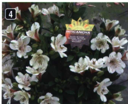
La familia de alstroemeria llamada Inticancha para planta en maceta de HK en flores: Red(1), Pink Heart(2), Purple(3) y White (4)