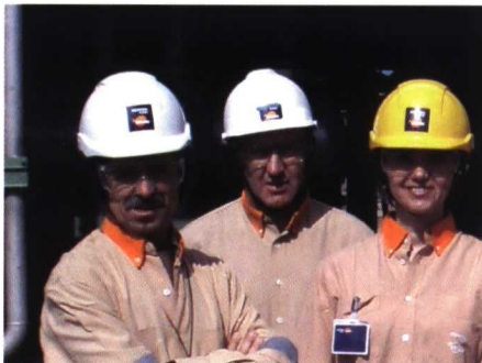
Los trabajadores de Repsol adquieren el compromiso con sus clientes, ofreciendo una amplia gama de productos y grandes innovaciones.

Por otro lado, cada agricultor elige la cubierta de su invernadero o su acolchado por diferentes motivos. Y aunque en ocasiones premia el precio, cada día se buscan más materiales fiables que garanticen ciertos parámetros como duración, termicidad, antigoteo, efecto antiplagas, etc.