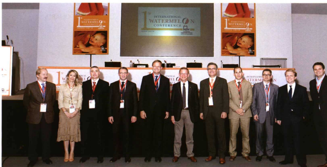
Imagen de grupo de los asistentes a la Primera Conferencia Internacional sobre la Sandía de Nunhems.