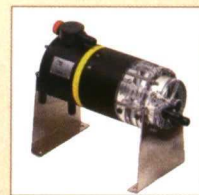
INYECTORES HIDRAULICOS FERTIC® Caudal :25/500l/h Presion: 1/12bar