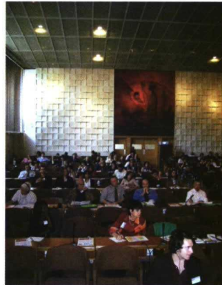
El plenario de la cumbre IFAVA en el salón de la UNESCO en París.