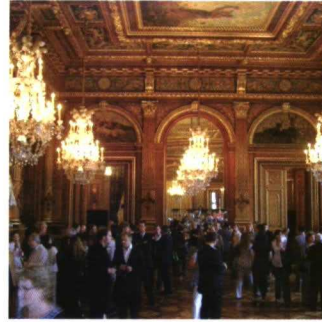
El agasajo de la alcaldía de París a orillas del Sena. En un escenario versallesco se discute de políticas para la expansión de la frutihorticultura y el consumo de frutas y verduras.

La declaración final llama a los gobiernos a "garantizar" a las organizaciones de las Naciones Unidas "los recursos para combatir el hambre y la malnutrición, cuando corresponda, mediante la realización de compras locales o regionales." Asimismo pide "poner en práctica políticas y medidas para asistir a los productores a incrementar su producción e integrarse con los mercados locales, regionales e internacionales".