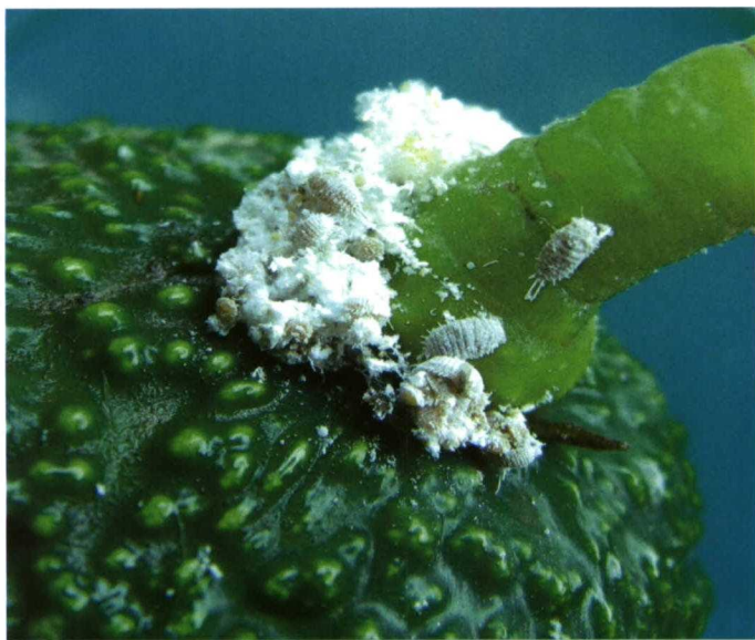
Colonia de Pseudococcus viburni .

De las especies mencionadas en el Cuadro 1, sólo Heliothrips haemorrhoidalis , pseudococcidos y diaspididos, producen pérdidas de valor comercial o rechazos en fruta de ex-