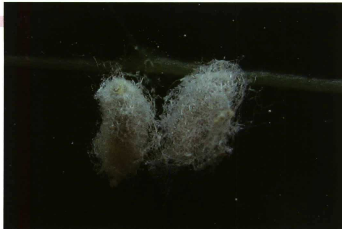
Pupas de Symphorobius maculipennis .

La época de muestreo y la frecuencia de éste dependen de la biología de cada plaga y de las condiciones ambientales existentes en la zona en que se encuentra el huerto. Con excepción de O. yothersi , las plagas en el palto tienen ciclos largos por lo que en plena estación primavera-verano el monitoreo se realiza cada 15 días y en el resto del año en forma mensual. O. yothersi puede alcanzar, durante la temporada estival, una alta población por lo que requiere ser monitoreados con una frecuencia semanal.