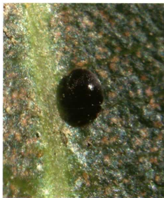
Colonia de diápididos en la fruta