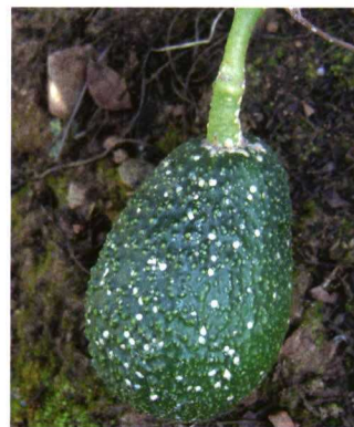
Pupa de Stethorus histrio .