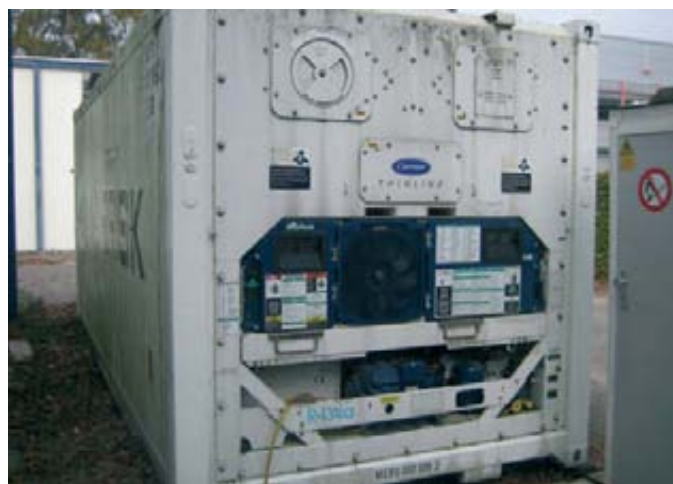
Foto 8 (izqda). Ensayos de conservación de patata en diferentes atmósferas controladas. Foto 9 (dcha.). Contenedor refrigerante que ahorra un 65% de energía.

lo que presumiblemente los costes de los análisis bajarán. La principal ventaja será que no necesitarán esperar entre cinco y seis semanas desde la toma de muestra para conocer los resultados de las virosis y poder exportar su patata, sino que con el PCR en pocos días tendrán todos los resultados.