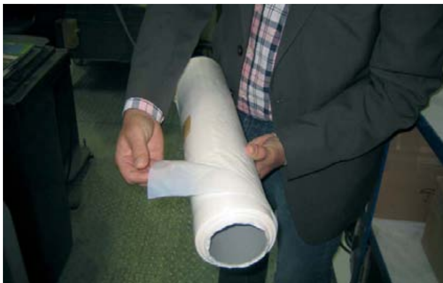
Foto 5. Plástico obtenido de almidón de patata.