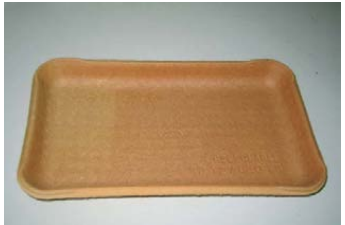
Foto 6 (izqda). Bandejas de almidón de patata y de hojas de tomate. Foto 7 (dcha.). Bandeja de fécula de patata, para embalar alimentos.

Holanda se lleva a cabo principalmente en los polders del noroeste, en terrenos ganados al mar, situados por debajo del nivel del mar y en los que se está bombeando continuamente agua fuera de los diques de contención.