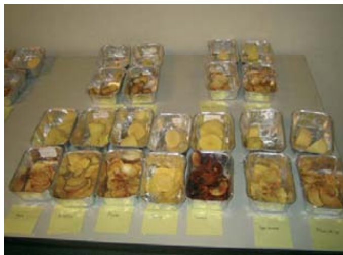
Foto 3 (izqda). Diferentes envases de patata. Foto 4 (dcha.). Ensayo de fritura de diferentes variedades de patata.

Se calcula que este hongo produce unas pérdidas anuales en el cultivo de patata en todo el mundo de más de 7.700 millones de euros. Siendo importante esta enfermedad en cualquier país del mundo, lo es mucho más en los Países Bajos, donde se dan habitualmente entre doce y quince tratamientos fungicidas contra la misma durante un ciclo de cultivo. Esto representa más de la mitad de todos los biocidas usados anualmente en Holanda. En años de veranos muy lluviosos, como 2012, ha sido necesario tratar los cultivos de patata prácticamente cada semana.