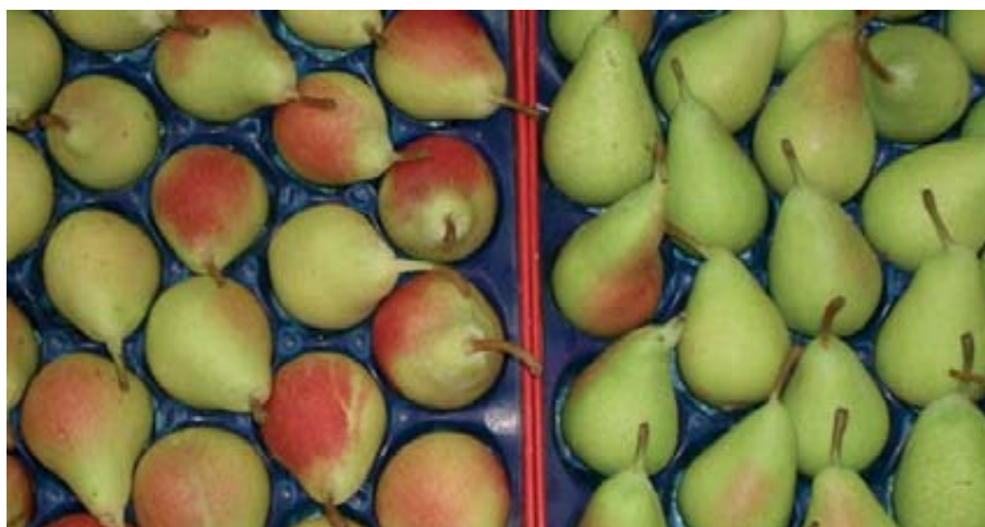
Foto 1. Frutos del peral Ercolini de la DO Pera de Jumilla.

color amarillo sobre fondo verde, con cierta chapa roja, más en los frutos de las zonas soleadas (foto 1), tiene pulpa firme, blanca, crujiente y jugosa, con un característico sabor dulce y baja acidez.