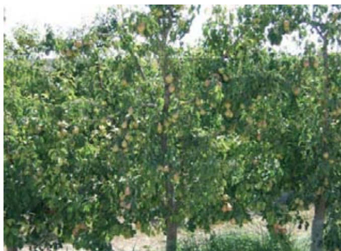
Foto 2 (izda.). En la mayoría de las fincas las producciones son anualmente casi similares, pero con diferente número de frutos, con lo que se obtuvieron frutos con distinto tamaño.