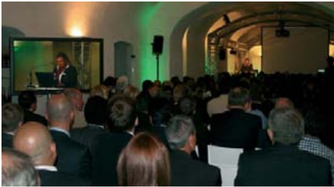
Distribuidores, clientes y periodistas se dieron cita el pasado 5 de junio en el castillo Eller (Essen) para celebrar el veinticinco aniversario de la compañía.