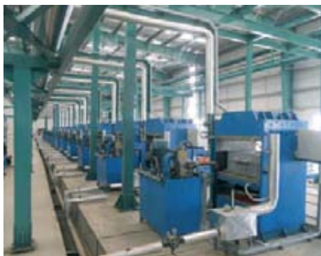
La nueva planta de construcción de BKT en Bhuj entrará en producción durante el tercer trimestre de este año, y alcanzará el 100% de su capacidad productiva (120.000 toneladas anuales) en marzo de 2015. En el mismo terreno está prevista la construcción de una ciudad.

to medio anual del 6-8%. Del mercado de neumáticos off-highway , BKT tiene una cuota de mercado mundial del 5% que espera duplicar de aquí a 2014, lo que supondría una facturación de 1.109 millones de euros. En los neumáticos off-highway de uso agrícola la compañía, que ha facturado 328,5 millones de euros en 2011, calcula que obtendrá una facturación de 587 millones en 2014. De hecho, se trata según sus cálculos del mercado que más va a crecer dentro de la línea off-highway , un dato especialmente significativo si tenemos en cuenta que durante el año 2011 el segmento agrícola representó el 60% de las ventas totales de BKT.