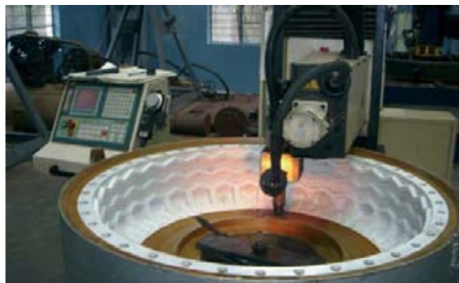
La compañía inauguró en octubre del año pasado una planta de construcción de moldes con lo que su capacidad de producción pasa de 100 a 270 moldes anuales.

Según explicó Rajiv Poddar, director ejecutivo de BKT, durante el evento celebrado en Essen, la nueva planta de Bhuj comenzará a producir en el tercer trimestre de 2012, una fecha que BKT da por segura a juzgar por el avance de la ejecución del proyecto. El porcentaje de producción de Bhuj será del 25% de la capacidad instalada en los primeros doce meses y del 75% en veinticuatro meses, para llegar al 100% de su capacidad productiva (120.000 t) en marzo de 2015. Además según destacó Rajiv Poddar, la planta de Bhuj podrá producir en una se-