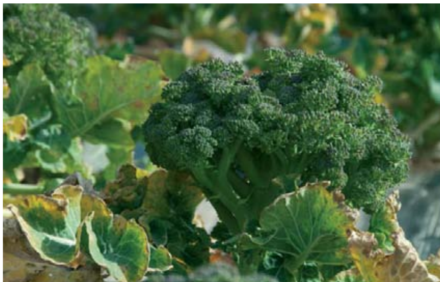
El brócoli es con 10.618 hectáreas registradas en el último año, el segundo cultivo en superficie de la Región de Murcia.

PIB regional. Su importancia socioeconómica se deriva también de los efectos indirectos que produce en actividades dependientes (empresas de servicios, maquinaria, instalaciones y construcciones, y los correspondientes inputs). En 2011 la producción aumentó un 1%, aunque, debido a los bajos precios, el valor total (607 millones de euros) disminuyó en un 17% en relación a 2010.