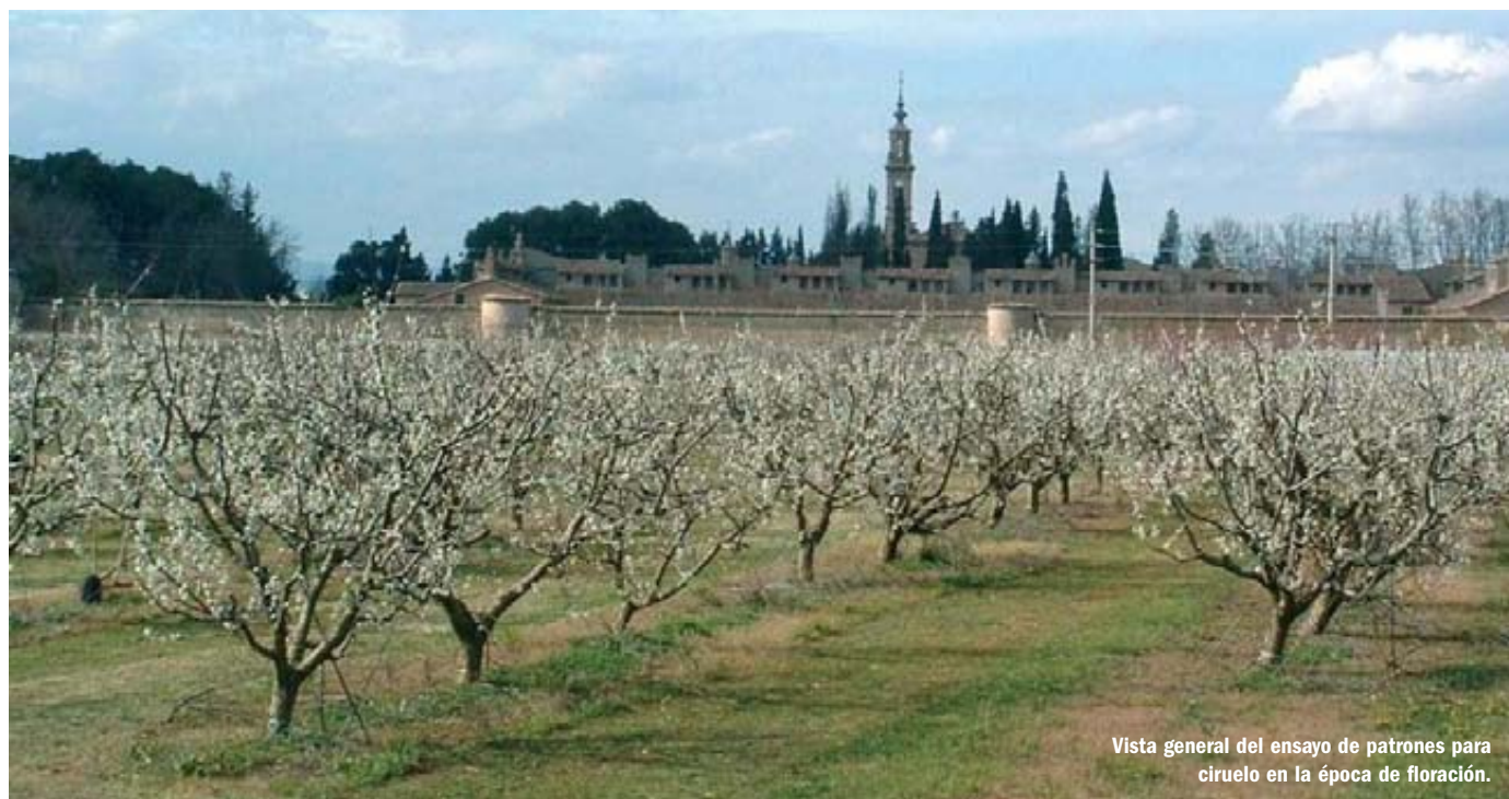
Vista general del ensayo de patrones para ciruelo en la época de floración.

En este trabajo se estudia la influencia de cinco patrones de ciruelo (Adara, Ademir, Mirobolán 713 AD, Miral 3278 AD y Mirobolán B), sobre el comportamiento agronómico y la calidad del fruto de dos variedades de ciruela Reina Claudia (R.C. de Bavay y R.C. Tardía de Chambourcy). El ensayo se plantó en el invierno de 1994-95 en la finca de la Estación Experimental de Aula Dei-CSIC (Zaragoza), en un suelo pesado y calizo, característico del área mediterránea.