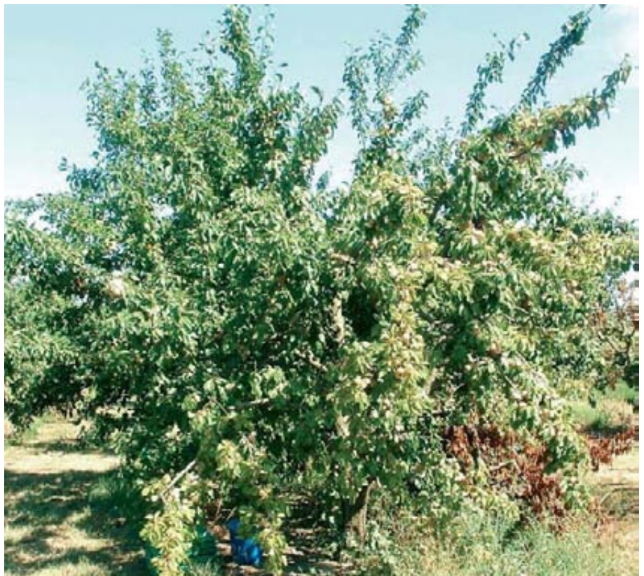
Síntomas de clorosis en Reina Claudia de Bavay sobre el patrón Mirobolán B.