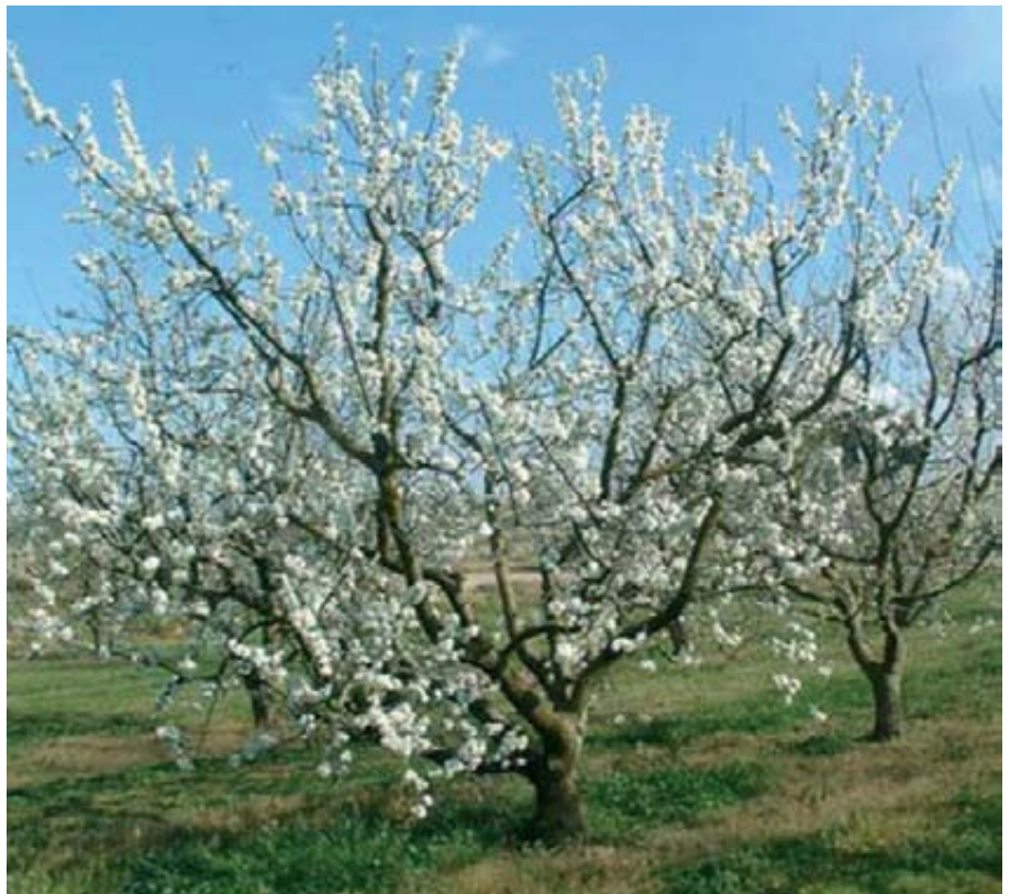
Árbol en floración de la variedad Reina Claudia Tardía de Chambourcy sobre el patrón Adara.

En el invierno de 1994-95 se plantaron los árboles de las variedades de ciruelo R.C. de Bavay y R.C. Tardía de Chambourcy, injertadas sobre varios patrones de ciruelo de crecimiento rápido. Entre ellos se encuentran los Mirobolanes ( P. cerasifera ): Adara, Ademir, Mirobolán B y Mirobolán 713 AD ya seleccionados o en fase de selección en la EEAD (Moreno, 2004), así como un híbrido interespecífico espontá-