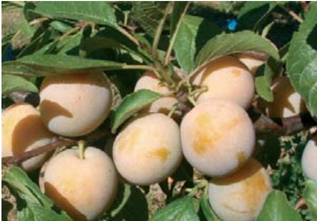
Detalle del fruto de la variedad Reina Claudia de Bavay sobre el patrón Ademir.

( 35 \pm 2,02 SSC/acidez valorable; 41 \pm 1,2 SSC/acidez valorable). Solamente se encontraron diferencias significativas en el índice de madurez en el año 2011 para la variedad R.C. de Bavay, cuando el patrón Adara indujo el mayor valor y Mirololán B el menor, sin diferir este patrón significativamente del resto de los patrones evaluados (datos no mostrados). ●