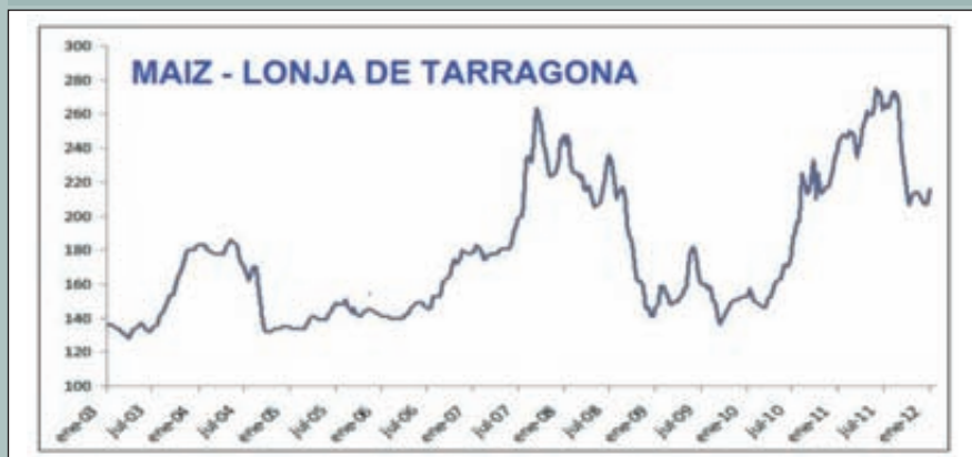
Evolución de los precios de maíz en la Lonja de Tarragona.

En cuanto a los precios, uno de los más seguidos en nuestro país son los valores que semanalmente se determinan en la Lonja de Tarragona. En la figura 3 se muestra como és-