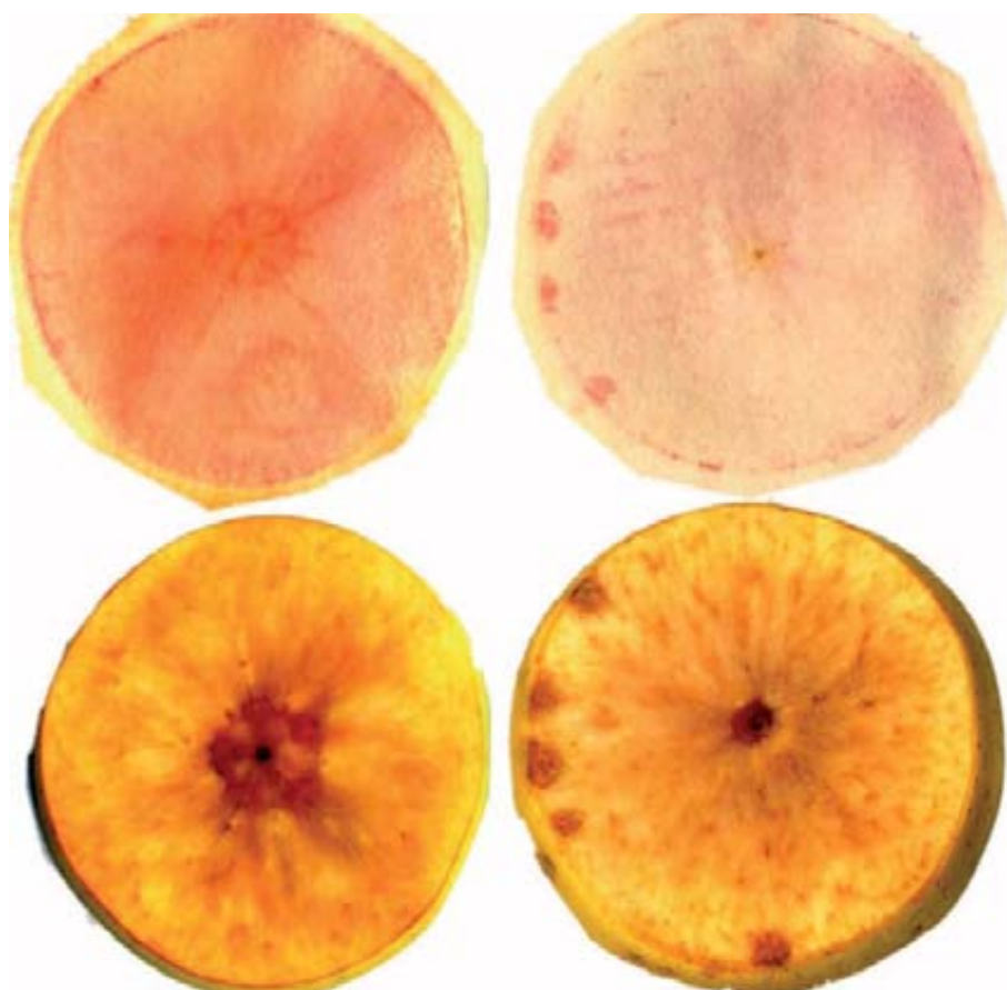
Foto 2. Ejemplo de tinción específica de calcio en secciones de fruto sano (izquierda) y afectado por bitter pit (derecha). En la parte superior se aprecia la huella de calcio soluble transferida a un soporte de papel.

del calcio en el fruto, de especial importancia para el diagnóstico e investigación de las calciopatías, ha consistido en el desarrollo de un método patentado en 2003 (Val, 2003) y publicado en 2008 (Val et al. , 2008), que permite evaluar de forma visual tanto el calcio soluble como el insoluble en secciones de fruto ( foto 2 ). Además, esta técnica puede aplicarse fácilmente con fines histológicos.