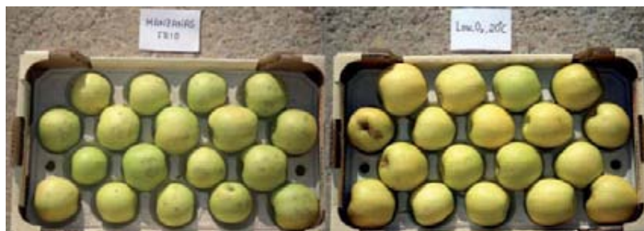
Foto 1. Apariencia externa de manzanas tras cuatro meses de almacenamiento en frío. Los frutos fueron previamente tratados en bajo O_2 , 20 °C durante 10 días (derecha) o directamente almacenados en frío convencional (izquierda).

cirse que el pretratamiento a 20°C y bajo oxígeno confirió a los frutos tratados unas características organolépticas y de calidad excepcionales.