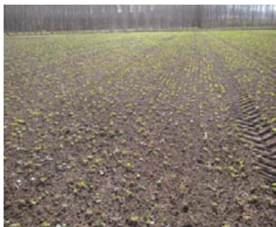
Nascencia del ensayo de colza de Caldes de Malavella (Girona).

Se ha realizado un análisis de contraste entre variedades híbridas y líneas para los distintos parámetros agronómicos ( cuadro VI ). No se han observado diferencias significativas en los parámetros de ciclo (fecha de inicio y fin de floración), en el peso específico, el encamado ni en el contenido en grasa. Las variedades híbridas ensayadas presentan alturas significativamente superiores que las línea (10 cm más). ●