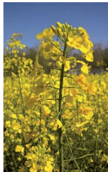
Detalle de una flor de colza.