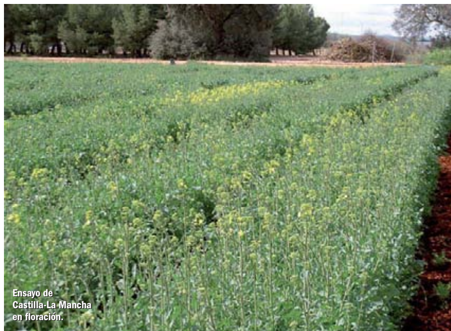
Ensayo de Castilla-La Mancha en floración.

Para el análisis conjunto de los datos, se han considerado trece ensayos realizados las campañas 2009-2010 y 2010-2011. Los ensayos se han realizado en parcelas pequeñas de una superficie comprendida entre 10