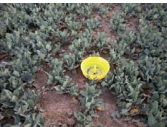
Trampa para la captura de adultos del gorgojo de la silficia.