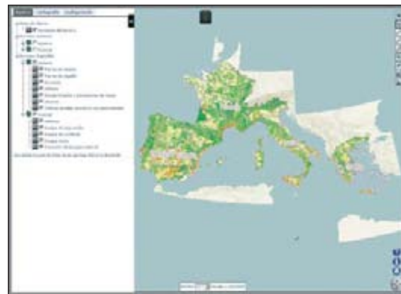
FIGURA 1 Aspecto del visor de Bioraise.

La aplicación permite obtener información sobre los recursos de la biomasa potencial o total generada y la disponible en la superficie de estudio. La cantidad de biomasa potencial se calcula a partir de un valor medio de productividad anual denominado VPMA para píxeles superficiales del terreno de 250 m de lado, según los usos del suelo aportados por Corine en ese