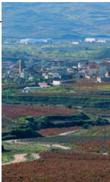
Con 26.473 nuevas hectáreas autorizadas en España, el total de las tres campañas de arranques subvencionados se eleva a 95.355 hectáreas.

Por tipo de producto, quien ha liderado, sin embargo, este gran incremento de nuestras ventas exteriores ha sido el vino sin DOP envasado, con un crecimiento próximo al 58% tanto en valor como en volumen. Es posible que haya errores derivados de la entrada en vigor este pasado año de la nueva nomenclatura combinada, por la que algunos códigos que antes identificaban unos vinos, pasan ahora a identificar otros, sin que quizás algunos operadores se hayan percatado. En todo caso, éste parece ser el producto estrella del año. Producto que sale a los mercados con un precio medio de 61 céntimos de euro frente a los 3,02 €/l, de media que presentan los vinos con DOP envasados. Éstos, los vinos con DO, consiguen acabar el año con un ligero incremento del 0,2% en valor, gracias a un buen mes de diciembre, y suavizando la caída en volumen, que acaba en el -3,8%. El otro gran componente de nuestras exportaciones en el pasado año 2010 en volumen fue el vino sin DOP a granel y en envases de más de 2 litros, cuyas exportaciones crecieron un 5% en valor y 11,5% en volumen, con caída del precio medio hasta los 31 céntimos de euro (-5,8%) y peor evolución