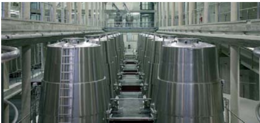
El otro gran componente de nuestras exportaciones en el pasado 2010 en volumen fue el vino sin DOP a granel y en envases de más de 2 litros, cuyas exportaciones crecieron un 5% en valor y 11,5% en volumen.

va de nuestras exportaciones, tanto en volumen como, más recientemente, en valor. Es el mercado exterior el que nos permite salvar los muebles este año.