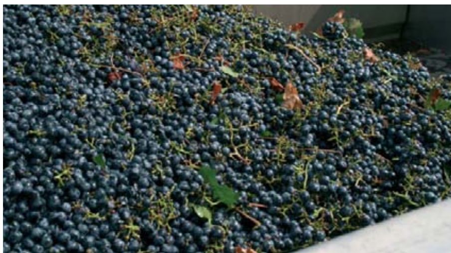
La producción de mosto y vino, con 39,5 millones como estimación prevista para la campaña 2010-11, muestra una gran estabilidad en las producciones.

plantaciones como sí por la mejora de la demanda de los diversos productos. En esta campaña 2010/11 se cierran ya las tres campañas para las que se preveían fondos europeos con los que subvencionar arranques de viñedo y se dispone ya de los datos de adjudicaciones para este año. Con 26.473 nuevas hectáreas autorizadas en España, el total de las tres campañas de arranques subvencionados se eleva a 95.355 hectáreas que, si se multiplican por un rendimiento medio en España de 36,4 hectolitros/ha, implicarían una disminución aproximada en la producción española de 3,5 millones de hectolitros; cálculo que probablemente no es correcto –aunque sí indicativo– por primar entre los arranques los de viñedos menos productivos. En todo caso, la experiencia nos demuestra que con muchas