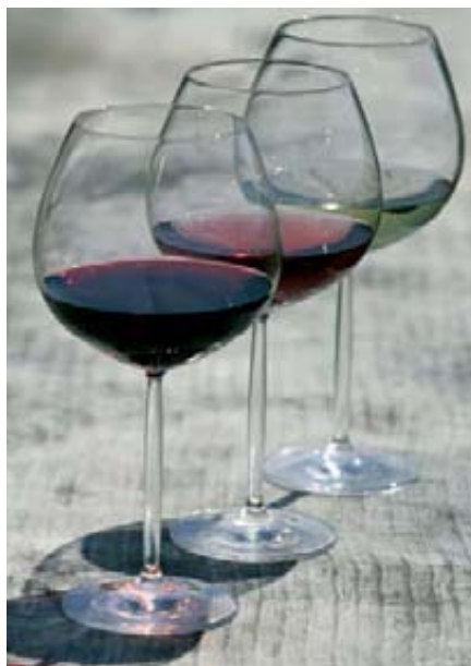
En los veintitrés años que han transcurrido desde la campaña 1987/88, los datos del balance vitivinícola reflejan una caída media anual del consumo nacional del -2,3%.

Si durante la primera mitad de 2010, fueron los graneles recuperados en mercados muy parados el año precedente, como Italia y Rusia, los que tiraban de las exportaciones, tras la vendimia y el ligero incremento de precios en origen, tal crecimiento parece enfriarse. Por su parte, el cava y otros espumosos llevan una tendencia parecida al resto de vinos con DOP y terminan el año en positivo en valor y limitando