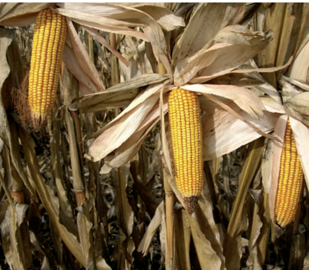
Mazorcas de maíz del ensayo de Terrer en Aragón.

También han colaborado empresas productoras de semillas de maíz.