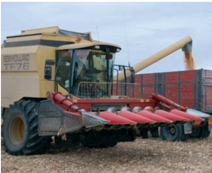
Cosecha de un campo de maíz en Aragón.