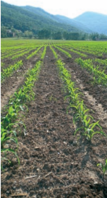
Ensayo de variedades de La Vall de Bianya en Cataluña.

El diseño de los ensayos ha sido en fila-columna latinizado o bloques al azar, con tres o cuatro repeticiones por cada variedad. El tamaño de la parcela elemental ha variado entre 24 y 30 m 2 , con cuatro hileras de maíz. Los parámetros se han evaluado normalmente en las dos hileras centrales.