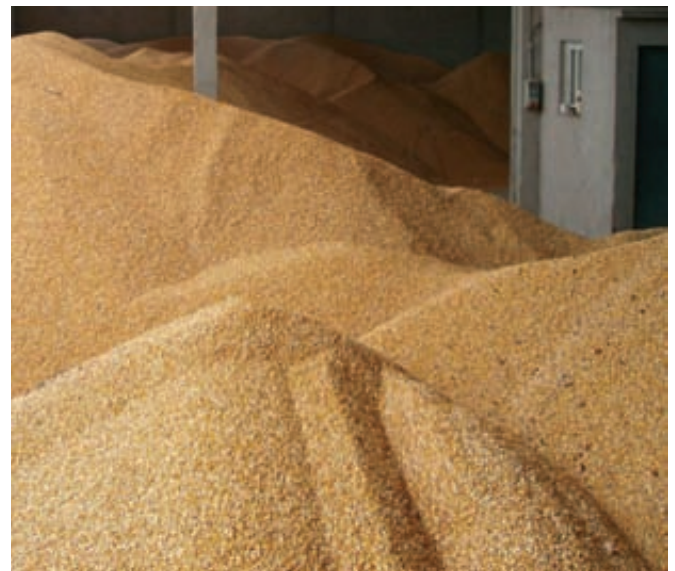
Almacén de maíz en Girona.