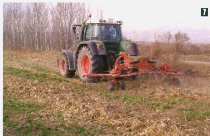
Foto 7. Rastrillo hilerador preparando los restos de maíz para su picado.