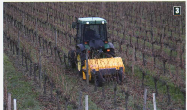
Fotos 3 y 4. Trituradoras trabajando con restos de viñedo.