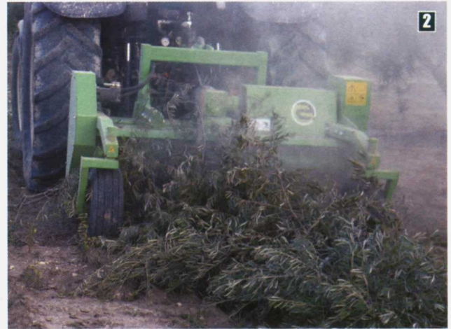
Foto 2. Trituradora trabajando con restos de poda de olivo.