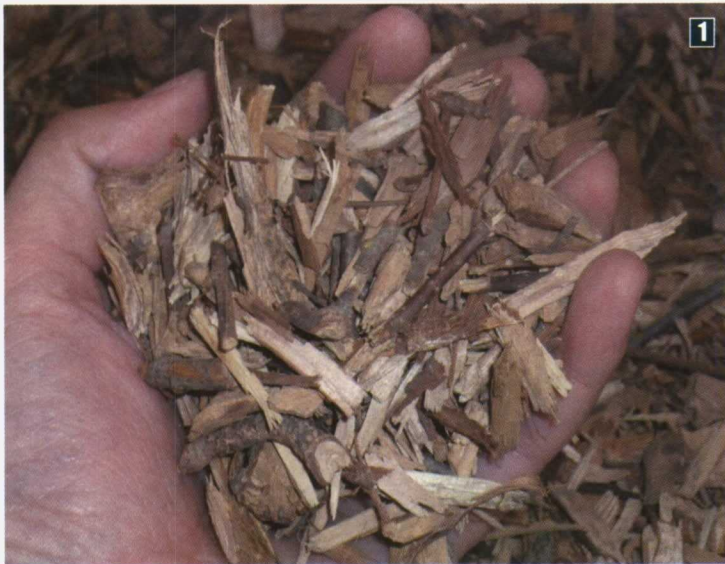
Foto 1. Restos de poda picados para su uso como combustible de calderas.