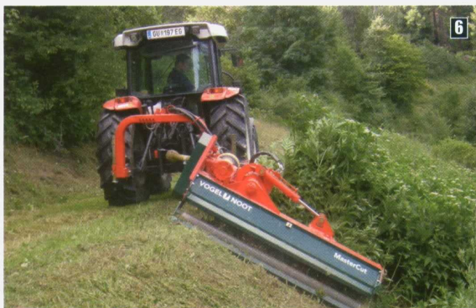
Foto 6. Trituradora para desbrozado de laderas.