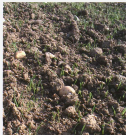
Foto izquierda: La fertilización es una inversión necesaria y fundamental, la cual debe llevarse a cabo de forma racional y sostenible, analizando correctamente la viabilidad económica de la explotación y siendo coherente con los nutrientes aportados. Imagen superior, derecha: El escaso abonado durante las dos últimas campañas de otoño o sementera ha provocado un importante descenso del contenido de nutrientes en el suelo de muchas explotaciones.

de forma racional y sostenible, analizando correctamente la viabilidad económica de la explotación y siendo coherente con los nutrientes aportados. Prescindir de ella no compensa ni al agricultor ni a la explotación, ya que el rendimiento de los cultivos y la fertilidad de los suelos se resienten.