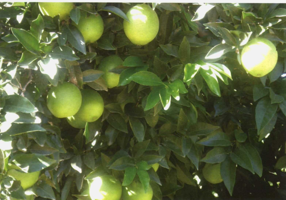
Málaga se alza como provincia líder en producción de limones seguida por Almería.

mayores cantidades de oferta en plazo y mejorar la oferta de variedades y marcas. Para mejorar la posición competitiva del sector y sus capacidades de crecimiento sostenido, este informe plantea como objetivos específicos mejorar el marco de acceso sostenible a los recursos básicos para la producción, orientar la producción a una mayor competitividad y diferenciación, potenciar la I+D+i en producción, comercialización y servicios asociados e incrementar y retener en Andalucía el valor añadido a lo largo de la cadena de producción y comercialización.