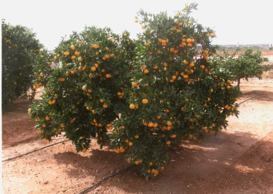
Por lo que se refiere a las mandarinas, este año la primera productora es Huelva con el 58% del total previsto.

de apreciar cómo durante el primer trimestre de la campaña (de septiembre a diciembre de 2009) los precios han oscilado entre 0,20 euros y 0,22 euros/kg frente a la horquilla de entre 0,13 y 0,21 euros/kg del mismo período de 2008. Además, desde comienzos de 2010, la cifra es aún mejor, ya que se estiman unos precios en origen de 0,23 euros/kg durante el mes de enero y 0,24 los meses de febrero y marzo de 2010, que frente a los 0,17 euros de media el kilo del mismo trimestre de 2009 (entre 0,13 euros/kg y 0,21 euros/kg), supone de media un incremento del 30% del precio de origen de todas las variedades de naranja en comparación con la campaña anterior.