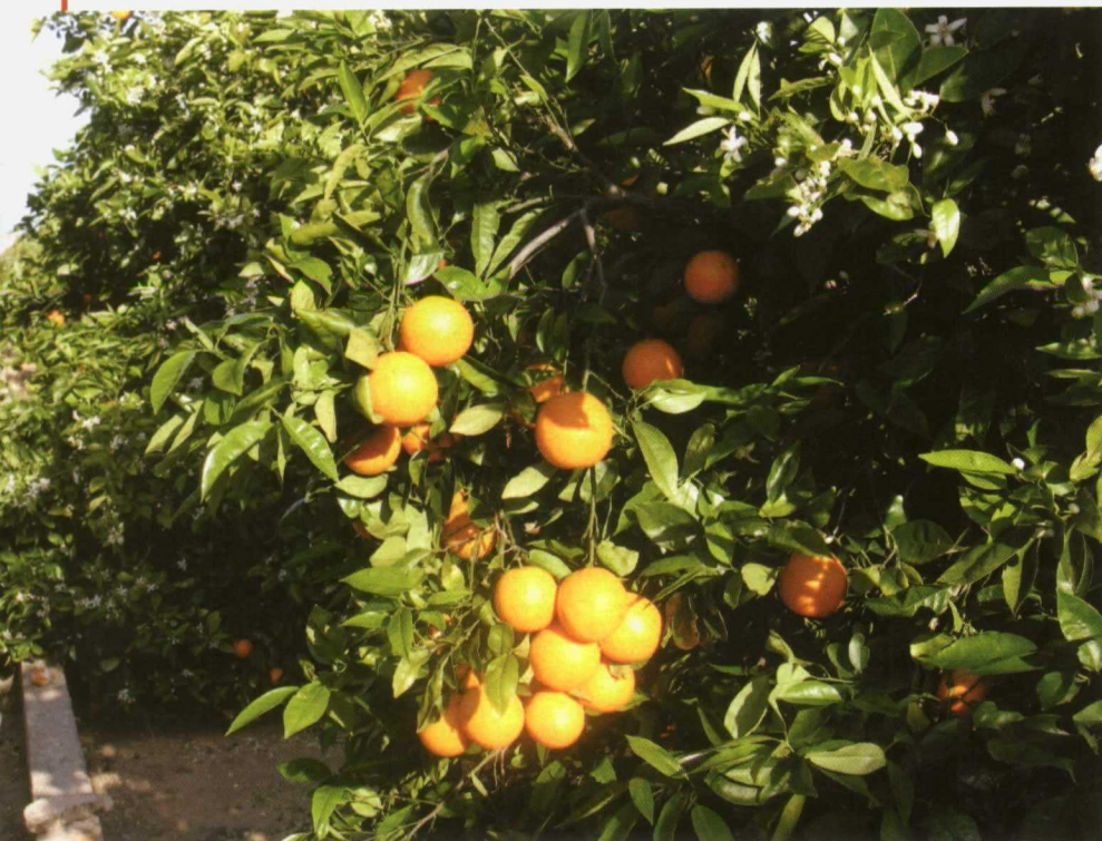
Del total de cítricos producidos en Andalucía el 73% serán naranjas dulces, siendo Sevilla la primera productora.

Por lo que se refiere a las mandarinas, este año la primera productora es Huelva con el 58% del total previsto, seguida por Sevilla