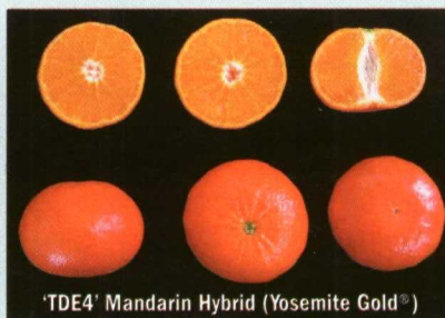
'TDE4' Mandarin Hybrid (Yosemite Gold®)