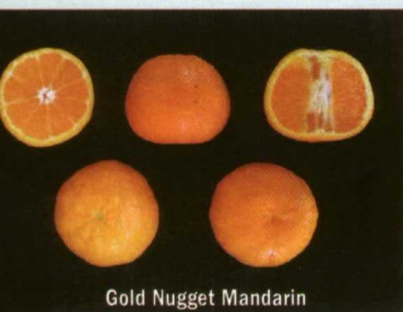
Gold Nugget Mandarin

Con un 42% de zumo y un peso medio de 175 g por fruto, Yosemite Gold madura en febrero pero puede mantener la fruta en el ár-