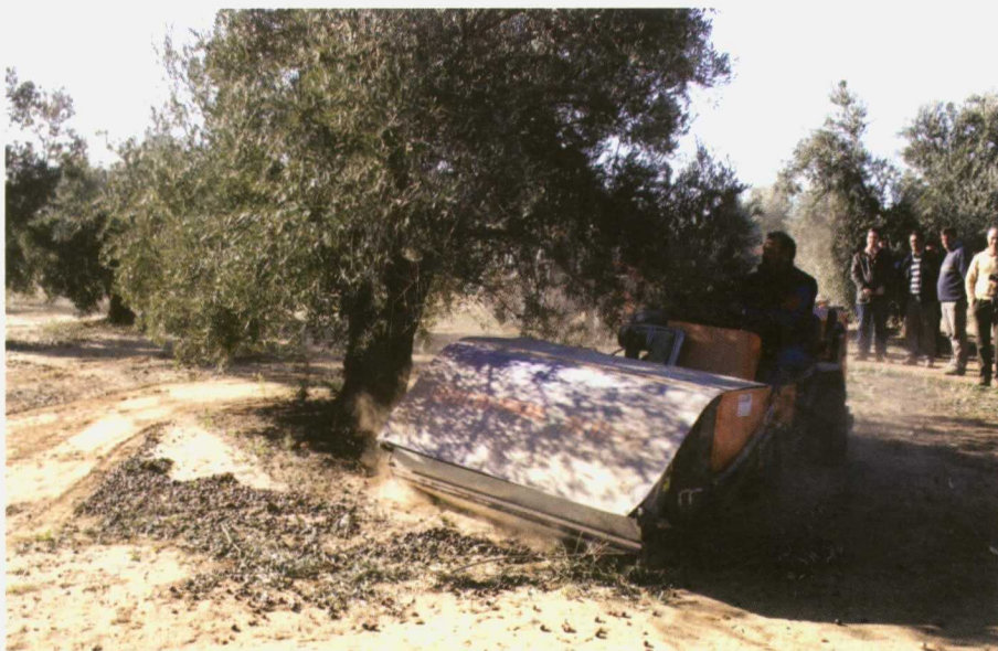
Habrà que tener tambièn en cuenta las incidencias sobre la calidad del aceite del fruto recogido en suelo.

Se trata de una decisi3n que debe adoptar el Comitè de Gesti3n correspondiente de la Comisi3n Europea.