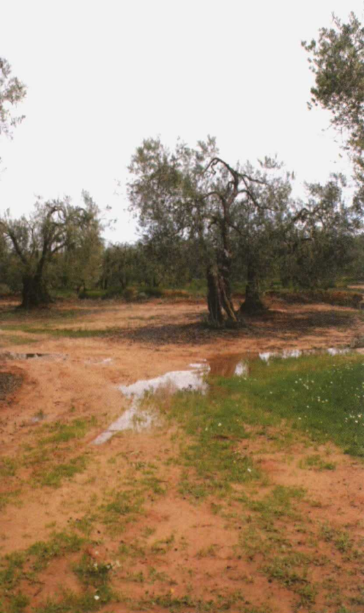
La recogida se ha retrasado en la mayor parte de las comunidades autónomas por los temporales de lluvia y viento.

cionado con cierta prudencia, indicando que los precios de venta en origen del aceite de oliva, aunque algo más bajos que en las mismas fechas de la campaña anterior, aun no están cerca de las cotizaciones que desencadenan esta medida de regulación del mercado, como se observa en el cuadro V .