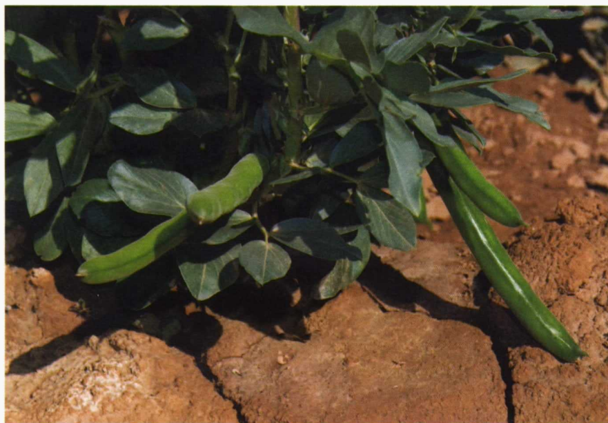
Sembrar al menos el 20% de la superficie beneficiaria con oleaginosas, proteaginosas o leguminosas elegibles con un máximo de 100 hectáreas por solicitud.

3. Sembrar al menos el 20% de la superficie beneficiaria con oleaginosas, proteaginosas o leguminosas elegibles ( cuadro I ).