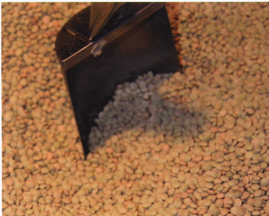
En caso de rebasarse la superficie base en el Programa Nacional para la Calidad de las Legumbres se compensarán prioritariamente las superficies dedicadas a DOP e IGP.

rianuales con la agroambiental del PDR. Podrá beneficiarse de la ayuda del PNFR.