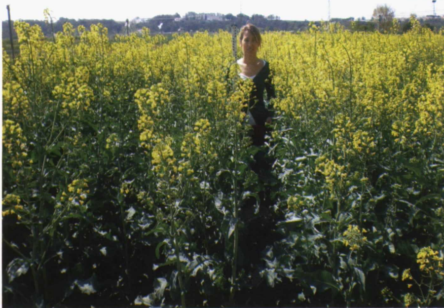
Evaluación de la altura de la colza en un ensayo de Extremadura.

das las dos últimas campañas. Se observa un comportamiento diferencial de rendimiento entre las variedades ensayadas ( p=0,0022 ), siendo las variedades híbridas Toccata y Excalibur las más productivas, con diferencias significativas con Liprima y Hycolor. Ninguna