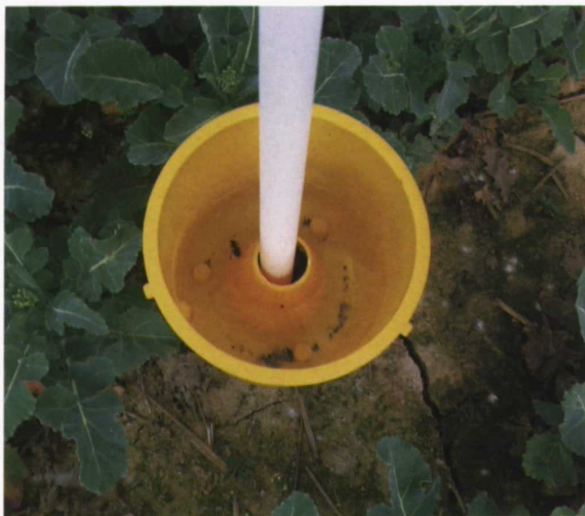
Trampas de captura de Ceutorrynchus assimilis instaladas en el ensayo de Caldes de Malavella (Catalunya).