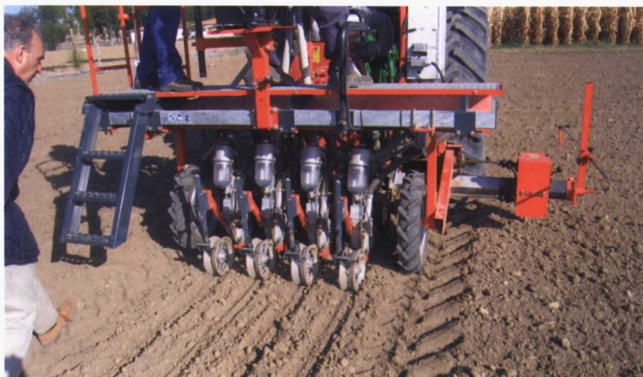
Siembra de un ensayo de colza en Madrid.

mes de septiembre, en la que las lluvias no están garantizadas en ninguna zona española, para favorecer unas buenas nascencias.