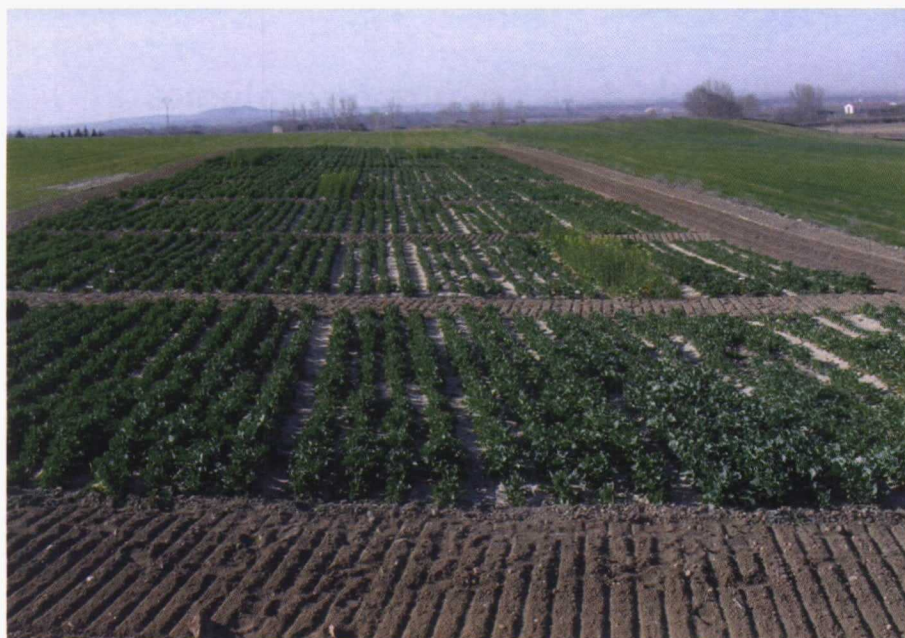
Ensayo de colza de Fresno de la Ribera (Castilla y León).