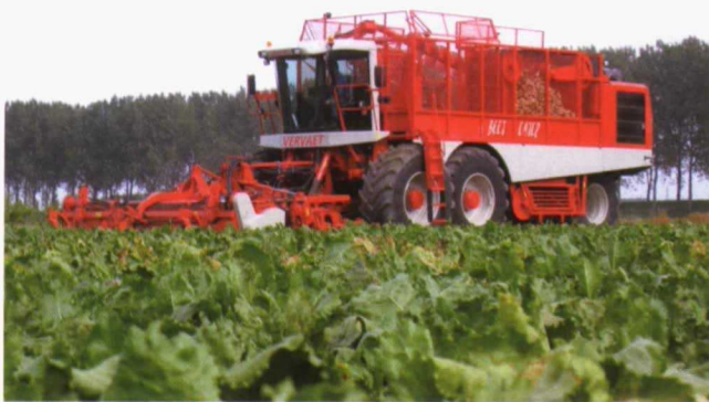
Las cosechadoras de remolacha siguen necesitando la confección de un itinerario predeterminado