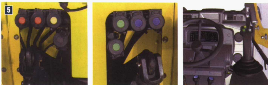
Foto 5. Las opciones de salidas para servicios exteriores son muy completas y pueden, opcionalmente, disponer de un mando único tipo joystick.