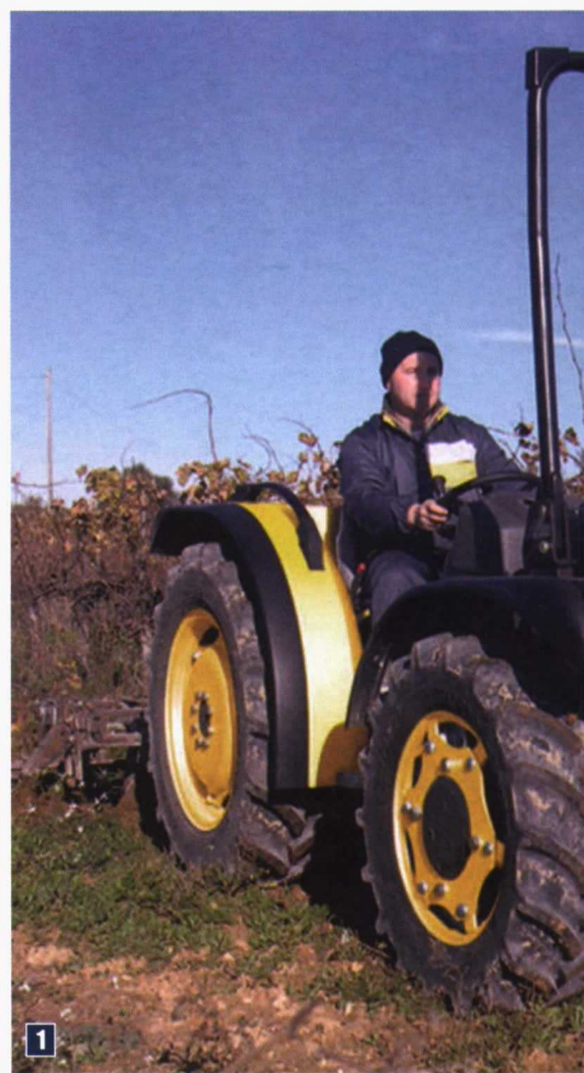
1. El tractor en la viña, a punto de empezar la prueba.

Recién terminada la vendimia empieza el ciclo de cultivo anual. En este momento, y en función del régimen de lluvias, la mayor parte de las fincas realizan un pase de cultivador para controlar las malas hierbas, oxigenar el suelo y, sobre todo, para facilitar la penetración del agua en el terreno. Es frecuente el uso de cultivadores robustos, de nueve a once brazos, con los dos de los extremos basculantes, (pueden estar en posición de trabajo o volteados hacia arriba) que se adaptan a la anchura de las calles y a la resistencia del suelo. Un cultivador de tales características ha sido el que hemos utilizado en esta prueba de campo. Clavándolo profundo, por debajo de los 30-35 cm,