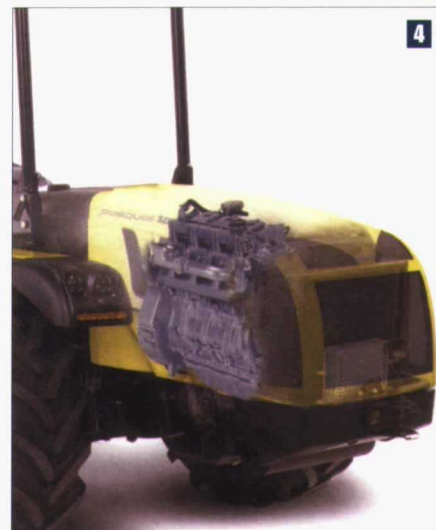
Foto 4. La posición muy adelantada del motor, prácticamente encima del eje delantero, representa una enorme ventaja para la adherencia del tractor y para la capacidad de elevación del hidráulico.

Estas medidas variarán en cuanto el tractor equiepe neumáticos distintos, entre los que nos ofrece una gama bastante amplia, pero una cosa es bien segura: nos hallamos ante un tractor pequeño de dimensiones, especialmente si tenemos en cuenta la potencia del motor. Podemos considerar excelente la adaptación al trabajo en hileras, incluso más estrechas que las de la finca en que realizamos la