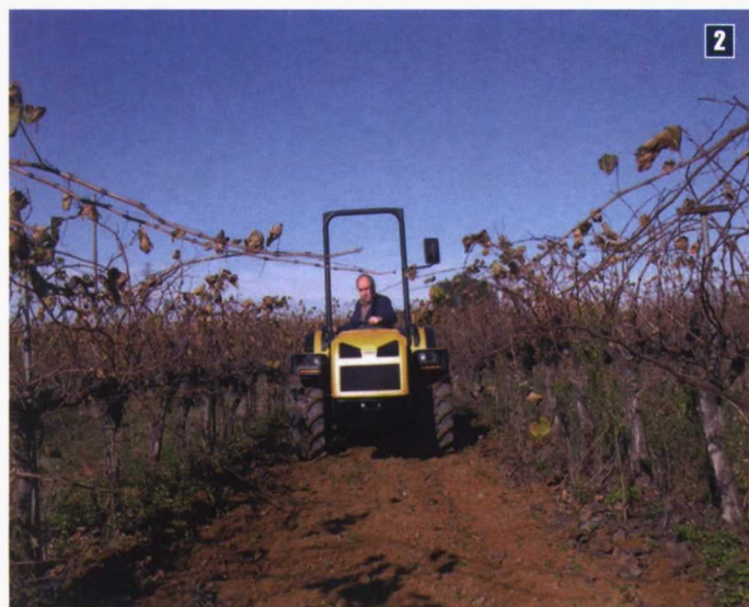
2. Una pasada, “en blando”, sobre terreno ya trabajado, para comparar resbalamientos. 3. Una vista general de la finca, muy representativa de esta parte del Penedès.

en una parcela libre de cultivo vecina a la viña “conseguimos hacer sacar todo el genio al tractor” y pudimos comprobar la eficacia del control de esfuerzo del elevador.