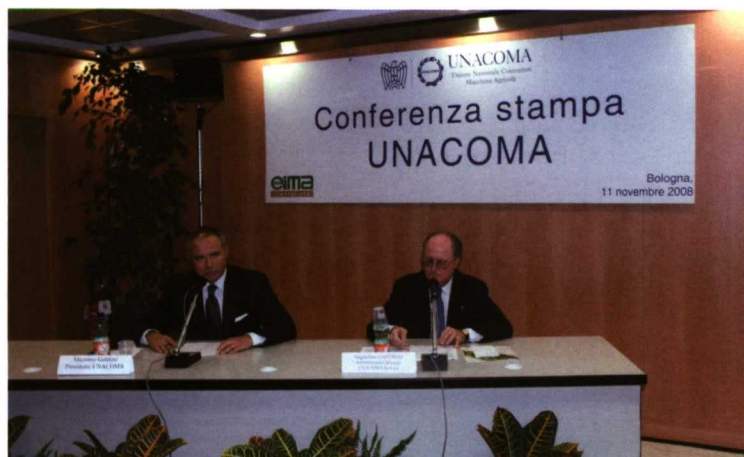
Massimo Goldoni, presidente de Unacoma y Guglielmo Gandino, director de Eima, durante la rueda de prensa Inaugural.

Más de 1.600 empresas expositoras procedentes de cuarenta países –que supone un incremento del 10%–, sobre un área de exposición de más de 105.000 m 2 , a lo largo, ancho y alto de una veintena de pabellones, que han recorrido más de 140.600 visitantes –lo que representa un incremento del 6% frente a la última edición–, es el balance de la feria que se ha celebrado del 12 al 16 de noviembre en Bolonia (Italia). De entre todos estos datos, cabe destacar que el número de visitantes extranjeros ha sido el que más ha aumentado, con un crecimiento del 25%, hasta situarse en más de 22.500 personas.