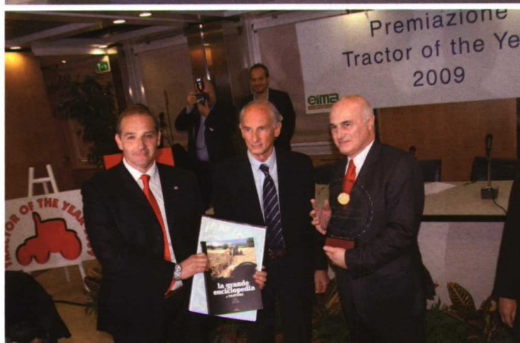
El Massey Ferguson 8690 ha sido galardonado con el Tractor of the Year 2009.

biocombustibles. También aumentará el cultivo de caña de azúcar, especialmente en India y Brasil, mientras que los cultivos hortícolas disminuirán en la UE, y aumentarán en Rusia, China e India.