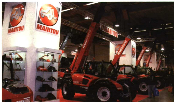
Las telescópicas, y entre ellas, la Manitrac de Manitou, también fueron galardonadas en el concurso de Innovación Tecnológica de Eima.

componentes principales y el desarrollo de productos futuros.